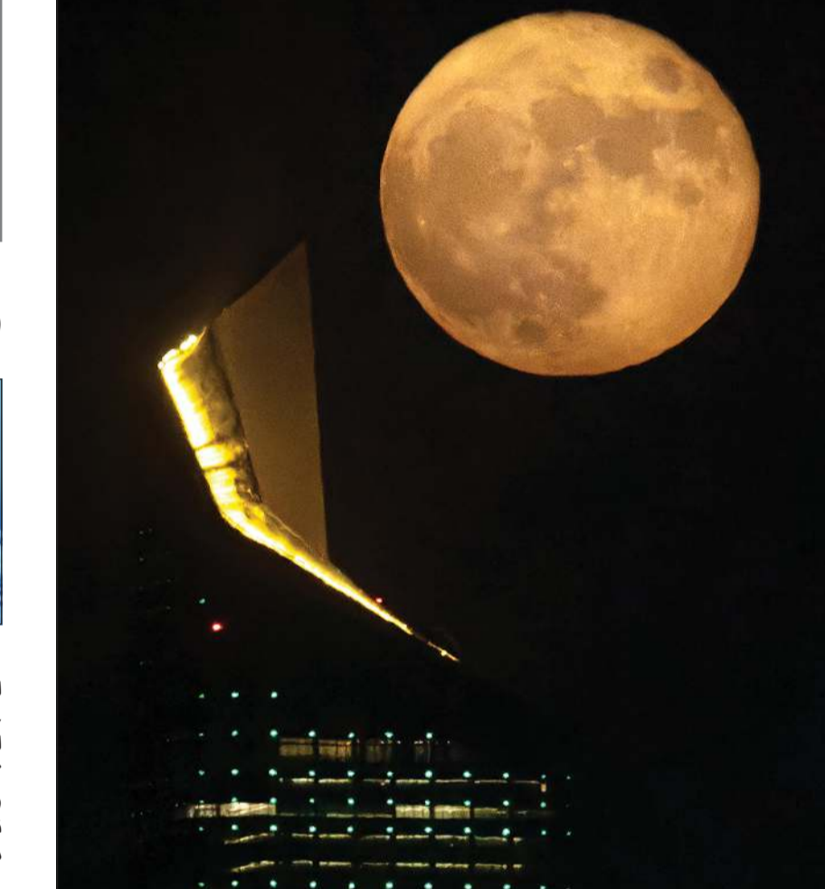
القمر العملاق في سماء الكويت

عبدالله المحارب - كونا: في لوحة سماوية ملهمة سطع قمر الكويت «عملاق» هذه الليلة في آخر بزوغ له هذا العام فيدأ مرحباً بزهاء وبهاء عند الحضور قبل الأقول ملوحاً ومودعاً وقت الرحيل بدرراً مزتراً ومكلاً بدرر متألثة. وتوغل الناظرون برويق المشهد المذهل فيما ازدهت السماء بعملاقها الشهي البهي راسمة جمانة من جمال متناجح بالسطوع منعم بحسن الطلعة ونقاء الضياء. «العملاق» الذي لا يأتي إلا نادراً نسج في طلوعه دائرة متوهجة فيدأ ضمناً بواقع 14% وأكثر لمعاناً بنسبة 30% ليسكن ولو فترة وجيزة في أقرب نقطة له من الأرض على الاطلاق كأنه يريد أن يسجل زيارة سريعة تصافح بصوتها بأبصار الحالين. وقبل أن يودع أرضنا وسماهاً وزرع «العملاق» ما شاء من جمال لا يضاوي مدركاً أنه لن يعود قبل شهور مديدة لياتينا مرة أخرى في يوليو المقبل حين تزخر الأرض شوقاً لبهائه الساطع ونشوره الواوع. عبدالله المحارب - كونا: «العملاق» الذي لا يأتي إلا نادراً نسج في طلوعه دائرة متوهجة فيدأ ضمناً بواقع 14% وأكثر لمعاناً بنسبة 30% ليسكن ولو فترة وجيزة في أقرب نقطة له من الأرض على الاطلاق كأنه يريد أن يسجل زيارة سريعة تصافح بصوتها بأبصار الحالين. وقبل أن يودع أرضنا وسماهاً وزرع «العملاق» ما شاء من جمال لا يضاوي مدركاً أنه لن يعود قبل شهور مديدة لياتينا مرة أخرى في يوليو المقبل حين تزخر الأرض شوقاً لبهائه الساطع ونشوره الواوع.