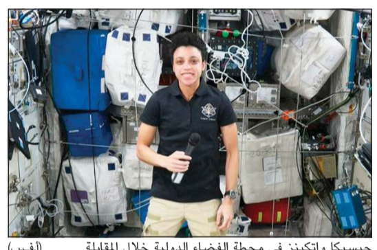
جيسكا واتكينز في محطة الفضاء الدولية خلال المقابلة

عبدالله المحارب - كونا: في لوحة سماوية ملهمة سطع قمر الكويت «عملاق» هذه الليلة في آخر بزوغ له هذا العام فيدأ مرحباً بزهاء وبهاء عند الحضور قبل الأقول ملوحاً ومودعاً وقت الرحيل بدرراً مزتراً ومكلاً بدرر متألثة. وتوغل الناظرون برويق المشهد المذهل فيما ازدهت السماء بعملاقها الشهي البهي راسمة جمانة من جمال متناجح بالسطوع منعم بحسن الطلعة ونقاء الضياء. «العملاق» الذي لا يأتي إلا نادراً نسج في طلوعه دائرة متوهجة فيدأ ضمناً بواقع 14% وأكثر لمعاناً بنسبة 30% ليسكن ولو فترة وجيزة في أقرب نقطة له من الأرض على الاطلاق كأنه يريد أن يسجل زيارة سريعة تصافح بصوتها بأبصار الحالين. وقبل أن يودع أرضنا وسماهاً وزرع «العملاق» ما شاء من جمال لا يضاوي مدركاً أنه لن يعود قبل شهور مديدة لياتينا مرة أخرى في يوليو المقبل حين تزخر الأرض شوقاً لبهائه الساطع ونشوره الواوع. عبدالله المحارب - كونا: «العملاق» الذي لا يأتي إلا نادراً نسج في طلوعه دائرة متوهجة فيدأ ضمناً بواقع 14% وأكثر لمعاناً بنسبة 30% ليسكن ولو فترة وجيزة في أقرب نقطة له من الأرض على الاطلاق كأنه يريد أن يسجل زيارة سريعة تصافح بصوتها بأبصار الحالين. وقبل أن يودع أرضنا وسماهاً وزرع «العملاق» ما شاء من جمال لا يضاوي مدركاً أنه لن يعود قبل شهور مديدة لياتينا مرة أخرى في يوليو المقبل حين تزخر الأرض شوقاً لبهائه الساطع ونشوره الواوع.