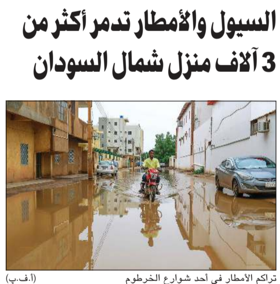
تراكم الأمطار في أحد شوارع الخرطوم (أ.ف.ب)

لوس أنجلوس - (أ.ف.ب): توفيت الممثلة الأميركية آن هيش التي نقلت الأسبوع الفائت إلى المستشفى في حال خطيرة بعد تعرضها لحادث سير في لوس أنجلوس، على ما أعلنت ناطقة باسم الممثلة. وكانت الممثلة البالغة 53 عاماً دخلت في غيبوبة نتيجة تعرضها لإصابات بالغة في الدماغ جراء حادث سير كبير تعرضت له في 5 أغسطس اصطدمت خلاله سيارتها بمنزل من طابقين في حي مار فيستا، ما تسبب في أضرار جسيمة واندلاع حريق هائل على ما أعلنت حينها أجهزة الإنقاذ في لوس أنجلوس. ونكرت وسائل إعلام محلية أن نتائج التحاليل الأولية التي أجريت للممثلة أظهرت وجود مادة مخدرة، لكن ينبغي إجراء تحاليل أخرى للتأكد من أن النتيجة الإيجابية غير مرتبطة بعلاج طبي. وأشار موقع «تي إم زي» المتخصص في أخبار المشاهير نقلاً عن مصادر في الشرطة إلى أن تحاليل الدم التي أجريت للممثلة بينت وجود مادتي الكوكايين والفنتانيل الذي يشكل مادة افئونة اصطناعية تسبب الإدمان وتستخدم في بعض العلاجات. وشاركت آن هيش في عدد كبير من أفلام تسعينيات القرن الماضي من أبرزها «سيكس دايز» سيفن نايتس» و«دوني براكسو». واشتهرت في دور أدته في مسلسل «ناتدر وورد» وحازت بفضلها جائزة «داي تايم إيمي» سنة 1991.