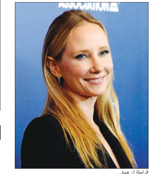
الراحلة آن هيش

لوس أنجلوس - (أ.ف.ب): توفيت الممثلة الأميركية آن هيش التي نقلت الأسبوع الفائت إلى المستشفى في حال خطيرة بعد تعرضها لحادث سير في لوس أنجلوس، على ما أعلنت ناطقة باسم الممثلة. وكانت الممثلة البالغة 53 عاماً دخلت في غيبوبة نتيجة تعرضها لإصابات بالغة في الدماغ جراء حادث سير كبير تعرضت له في 5 أغسطس اصطدمت خلاله سيارتها بمنزل من طابقين في حي مار فيستا، ما تسبب في أضرار جسيمة واندلاع حريق هائل على ما أعلنت حينها أجهزة الإنقاذ في لوس أنجلوس. ونكرت وسائل إعلام محلية أن نتائج التحاليل الأولية التي أجريت للممثلة أظهرت وجود مادة مخدرة، لكن ينبغي إجراء تحاليل أخرى للتأكد من أن النتيجة الإيجابية غير مرتبطة بعلاج طبي. وأشار موقع «تي إم زي» المتخصص في أخبار المشاهير نقلاً عن مصادر في الشرطة إلى أن تحاليل الدم التي أجريت للممثلة بينت وجود مادتي الكوكايين والفنتانيل الذي يشكل مادة افئونة اصطناعية تسبب الإدمان وتستخدم في بعض العلاجات. وشاركت آن هيش في عدد كبير من أفلام تسعينيات القرن الماضي من أبرزها «سيكس دايز» سيفن نايتس» و«دوني براكسو». واشتهرت في دور أدته في مسلسل «ناتدر وورد» وحازت بفضلها جائزة «داي تايم إيمي» سنة 1991.