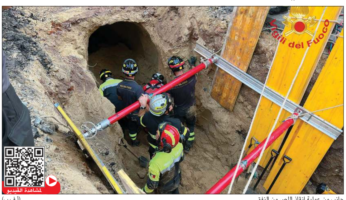
جانب من عملية إنقاذ اللص من النفق (أ.ف.ب)

روما - (أ.ف.ب): طمر رجل نحو 9 ساعات الخميس داخل نفق كان يحفره في روما مع شركائه للسطو على الأرحح على أحد المصارف، إذ انهار السقف عليه فبقي مدفوناً تحت الأنقاض إلى أن تم إخراجها، وفق ما أفادت الشرطة وكالة فرانس برس. وأوضح المكتب الإعلامي للشرطة أن «رجلين من نابولي أوقفا لمقاومتها عنصراً في الشرطة، وأخران من روما بسبب الأضرار التي حصلت، أحدهما كان في الحفرة وهو الآن في المستشفى». وأضاف المكتب الإعلامي أن «التحقيق لا يزال جارياً»، ولم يستبعد أن يكونوا لصوصاً، مشيراً إلى أنها «إحدى الفرضيات». وعمل العشرات من عناصر الإطفاء على إغاثة رجل بقي مدفوناً تحت مئات الكيلوغرامات من التراب و مواد البناء بعد انهيار النفق، وعلى إخراجها، بحسب ما لاحظ تلفزيون وكالة فرانس برس. وأفادت وسائل إعلام بأن الشرطة تشبهت في الرجل وشركائه الذين أوقفوا بالقرب من متجر فارغ كانوا يحفرون النفق تحته، كانوا يستهدفون مصرفاً قريباً خططوا للتسلل إليه في عطلة بنهاية الأسبوع. وأشارت صحيفة «كوريري ديلا سيريا» إلى أن «الرص علق تسع ساعات في النفق»، فيما أوضحت «لا ستامبيا» أن «الهدف كان دخول القيو»، و«تونت لا ريبوبليكا» إنه «حفر نفقاً لسرقة لكنه بقي مدفوناً».