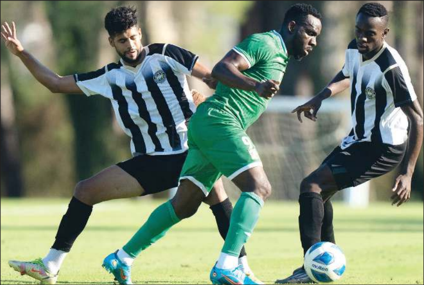
(المركز الإعلامي بالعربي)