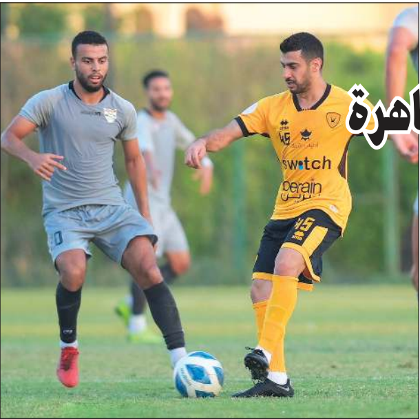
(المركز الإعلامي بالقاسية)

التي خاضها في مصر على الرغم من أنها جميعها جاءت مع فرق من الدرجة الثانية بسبب انشغال فرق الدوري الممتاز، مشيرا إلى أن المباريات كانت صعبة مع فرق تتميز بالجاهزية البدنية والفنية. إلى ذلك، تعود فجر اليوم بعثة الفريق الأول لكرة القدم في كاظمة من معسكر صربيا بعد أسبوعين من التدريبات والمباريات الودية أقامها الفريق بشكل مكثف في بلفراد، حيث كانت آخر الوديات أمام الظفرة