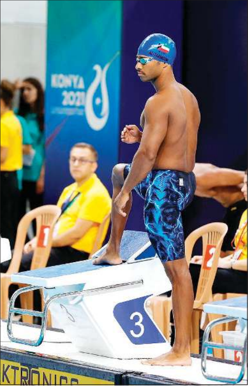
السباحة تجتحت في التاهل للأدوار النهائية