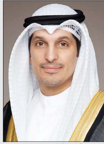
الوزير عبدالرحمن المطيري