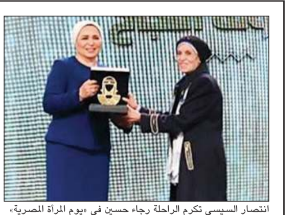
انتصار السيسي تكريم الراحلة رجاء حسين في «يوم المرأة المصرية»