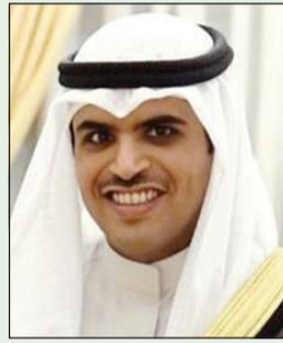
الشيخ خالد طلال الخالد

صدر مرسوم بتعيين الشيخ خالد طلال الخالد الصباح وكيلاً لديوان رئيس مجلس الوزراء سمو الشيخ أحمد النواف بالدرجة الممتازة، كما صدر مرسوم بتعيين حمد بدر العامر مديراً لمكتب رئيس مجلس الوزراء بدرجة وكيل.