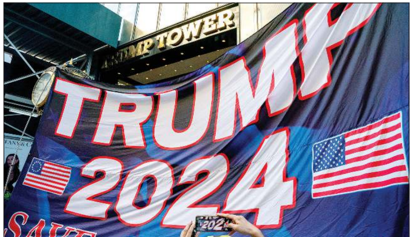
انتصار دونالد ترامب يرفعون لافتة تدعم ترشح الرئيس السابق أمام برج ترامب في نيويورك

واشنطن - وكالات: اتهم كتاب جديد يتناول الرئيس الأميركي السابق دونالد ترامب ومسؤوله سابقة في عهده، اتهامه بالاستهتار بالوثائق الرسمية، وذلك ترانما مع اقتحام عناصر من مكتب التحقيقات الفيدرالي «اف بي آي» مقر إقامته في منتجع «مار ايه لاغو» بفلوريدا، وهو ما اعتبره مسؤول سابق «انقلاباً سياسياً استباقياً» على الملياردير الأميركي. وقالت مراسلة صحيفة