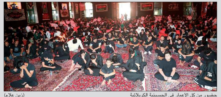
حضور من كل الأعمار في الحسينية الكربلائية (زين علام)

الحسينيات أحييت ذكرى استشهاد الإمام الحسين (عليه السلام) بالعبرات والدعاء 07