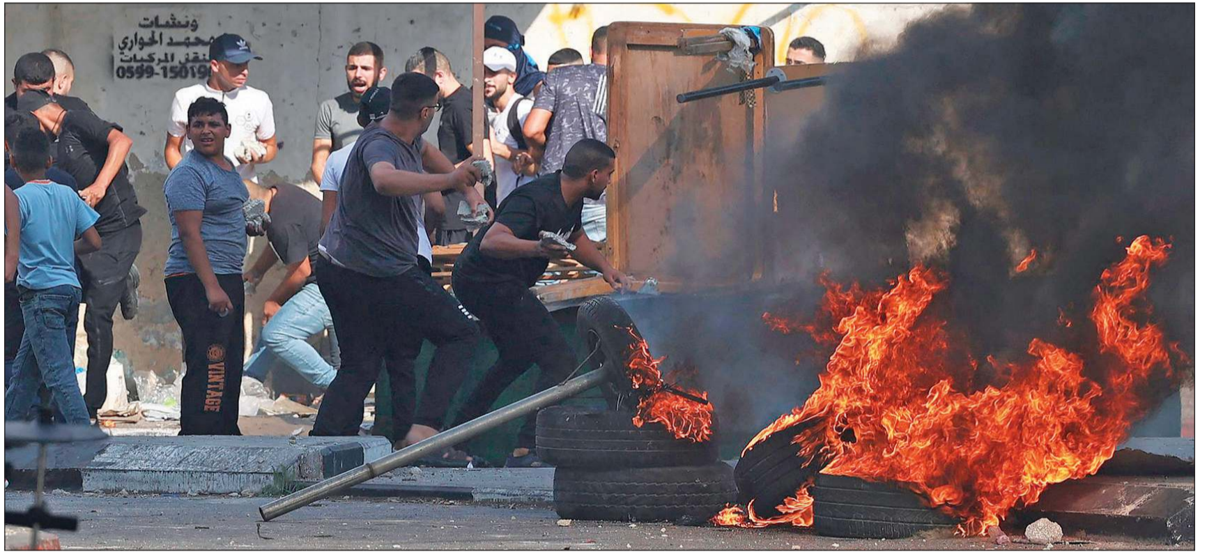
شبان فلسطينيون خلال مواجهات عنيفة مع قوات الاحتلال في نابلس أمس

حدثت. وحذرت الرئاسة الفلسطينية على لسان الناطق الرسمي باسمها نبيل أبو ريدية من «اقتراب الاحتلال من المواجهة الشاملة مع شعبنا الفلسطيني بأسره». من خلال عدوانه الذي بدأ من مدينة القدس، ومن ثم امتد إلى جنين وغزة ونابلس.. التفاصيل ص14