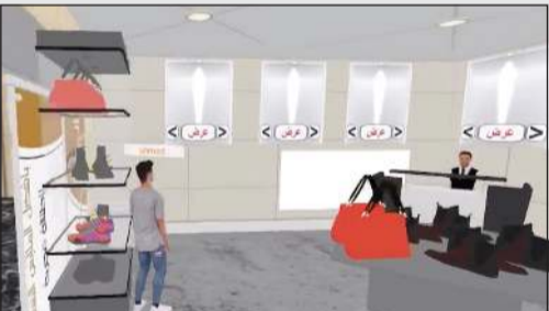
أحد المحلات في المجمّع