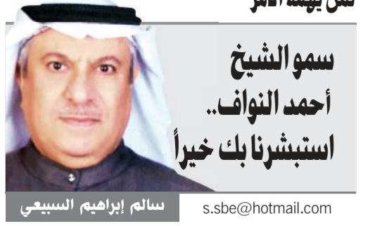
سمو الشيخ أحمد النواف.. استبشرونا بك خيراً

ما أجمل الدنيا، حين يكون رب الأسرة حكيمًا، وما أجملها، حين يكون رب الأسرة ورعًا تقياً، ما أجمل الدنيا، حين يكون رب الأسرة شجاعًا، وما أجملها حين يكون رب الأسرة عادلاً، نزيهاً، يستشعر هموم أبنائه، ويدأبونها، ويتعرف على رغباتهم فيحققها.