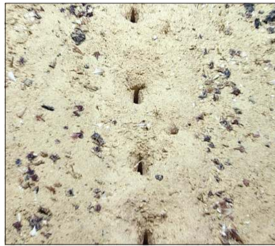
جانب من الثقوب التي عثر عليها في قاع المحيط

اكتشف علماء من الإدارة الوطنية الأميركية للمحيطات والغلاف الجوي ثقوباً غامضة في قاع المحيط الأطلسي، وطلدوا المساعدة عبر صفحة الإدارة على موقع فيسبوك من مستخدمي الإنترنت مد يد العون في حل هذا اللغز. وأوضحت الإدارة أنه تم اكتشاف هذه الثقوب السبت الماضي خلال رحلة استكشافية عمل فيها العلماء على جمع معلومات عن المياه العميقة بقاع المحيط، على الرغم من أنه كانت هناك تقارير سابقة عن وجودها في هذه المنطقة. ونشرت الإدارة على الصفحة صوراً للثقوب الغامضة، موضحة أنها موجودة على عمق 1,7 ميل تحت سطح مياه المحيط (نحو 3 كيلومترات) وأنها متحاذية بدقة عالية جداً، مضيئة: لاحظنا العديد من هذه المجموعات من الثقوب، ولا يزال مصدرها غامضاً. وقد أثار هذا التحدي الطريف العديد من ردود الأفعال الساخرة وخفيفة الظل بين من قال إن مخلوقات فضائية هي المسؤولة عن هذه الثقوب في قاع المحيط، ومن أرجع الأمر إلى كائنات غامضة، فيما قال أحد المتابعين إنها «ثقوب في كهف بقاع المحيط»!