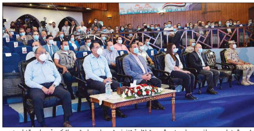
رئيس الوزراء د.مصطفى مدبولي يزور البحيرة لمتابعة تنفيذ مشروعات مبادرة «حياة كريمة»، بوادي النطرون

محافظة البحيرة ضمن مشروعات مبادرة «حياة كريمة». وقام د.مصطفى مدبولي، رئيس مجلس الوزراء، أمس بجولة تفقدية بمحافظة البحيرة، لمتابعة سير العمل بمشروعات المبادرة الرئاسية