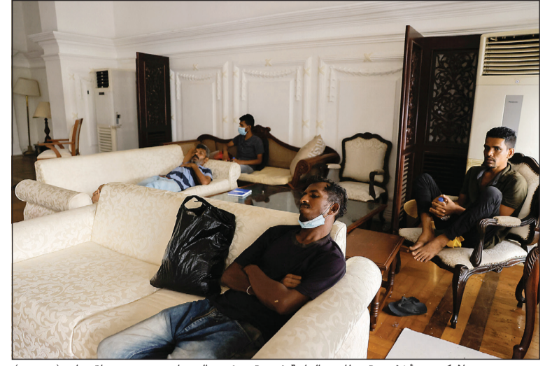
محتجون سريلاونكيون يأخذون قسطا من الراحة في مقر رئيس الوزراء بعد يوم من اقتحامه