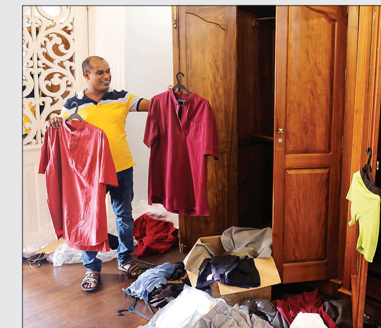
متظاهر يستعرض ملابس الرئيس المخلوع

كولومبو - أ.ف.ب: سلم متظاهرون في سريلانكا أمس محكمة سريلانكية ملايين الروبيات التي تركها الرئيس غوتابايا راجابكسا عندما فر من مقر إقامته الرسمي، وفق ما أعلنت الشرطة، في وقت بدأت معركة تسمية خليفة له. وبعد اقتحام القصر الرئاسي السبت، اكتشف المتظاهرون أوراقا نقدية بدا أنها طبعت حديثا تبلغ قيمتها 17,85 مليون روبية (حوالي 50 ألف دولار) وسلموها إلى الشرطة. وقال متحدث باسم الشرطة «تسلمت الشرطة النقود وسلمها إلى المحكمة»، وذكرت مصادر رسمية أنه تم العثور على حقيبة مليئة بالوثائق في المنزل الفخم. وانتقل راجابكسا للسكن في المبنى الذي شيد قبل قرنين بعدما أجبر على الفرار من منزله الخاص في 31 مارس جراء محاولة متظاهرين اقتحامه.