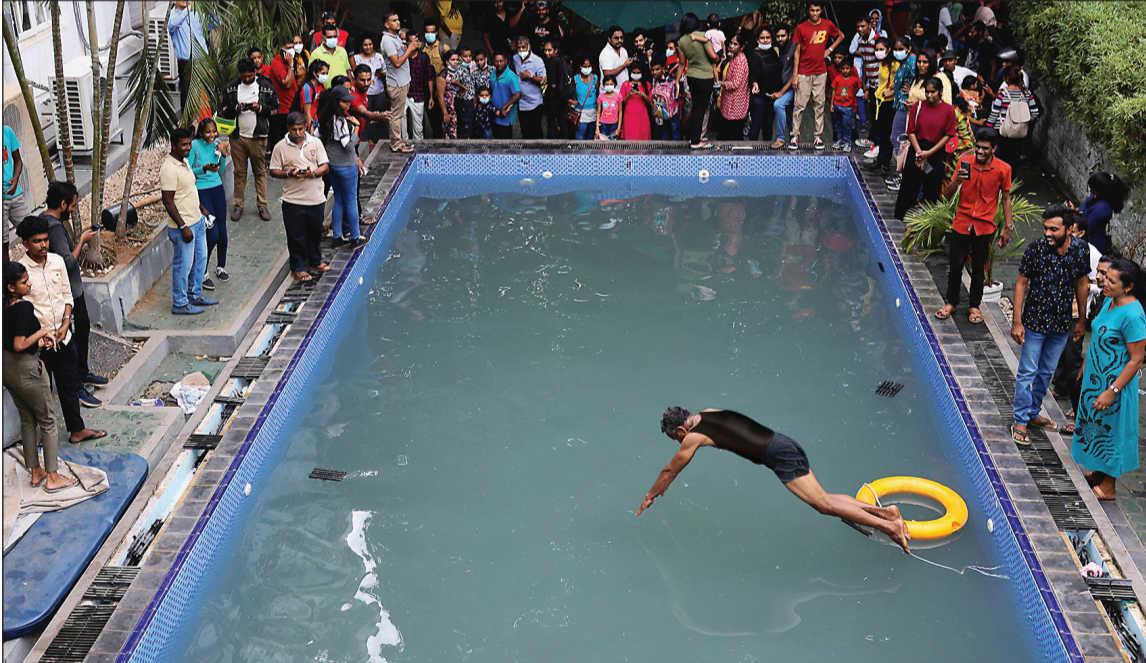
سريلاونكيون يزورون المنزل الرئاسي ويسبحون في مسبحه بعد أيام على اقتحامه وهروب الرئيس منه

ونكر مكتب رئيس الوزراء رانيل ويكرمينغ أن راجابكسا أبلغه رسميا بنيه الاستقالة من دون تحديد موعد لذلك. هذا، وقد صرح عضو بارز في الحكومة السريلانكية بأن البرلمان قرر أن يجري تصويتا في 20 يوليو الجاري لاختيار أحد أعضائه رئيسا للبلاد، ليحل محل الرئيس الحالي جوتابايا راجابكسا، الذي تعهد بالاستقالة غدا. وأضاف أنه تقرر أن يعقد البرلمان اجتماعا يوم الجمعة