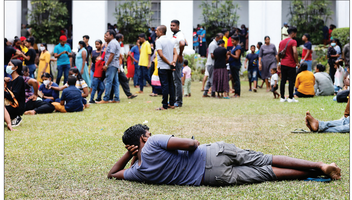
محتجون يرتاحون على العشب في حديقة القصر الرئاسي السريلانكي