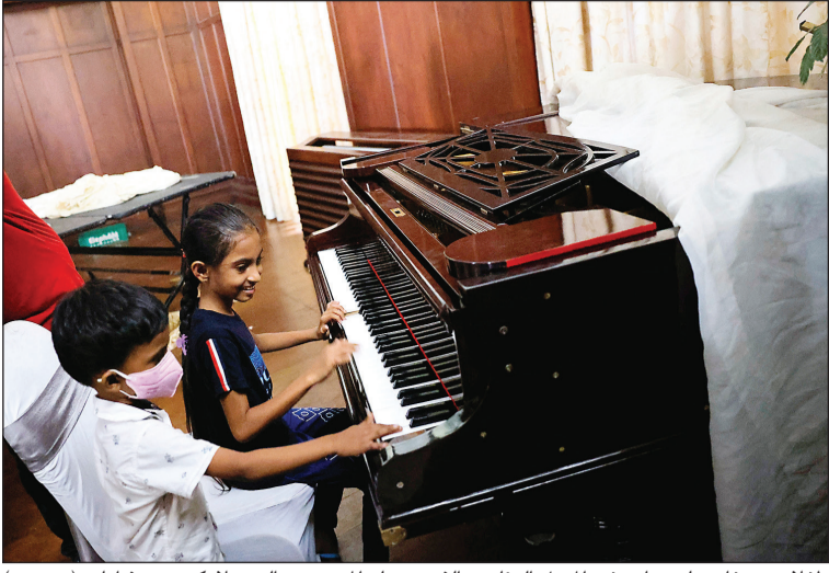
طفلان يعزفان على بيانو في المنزل الرئاسي الذي يحتله المحتجون السريلاونكيون منذ أيام