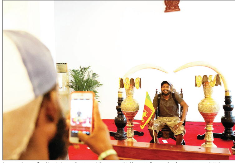
محتج يلتقط صورة من على كرسي الرئيس المخلوع حيث كان يعقد الاجتماعات المهمة