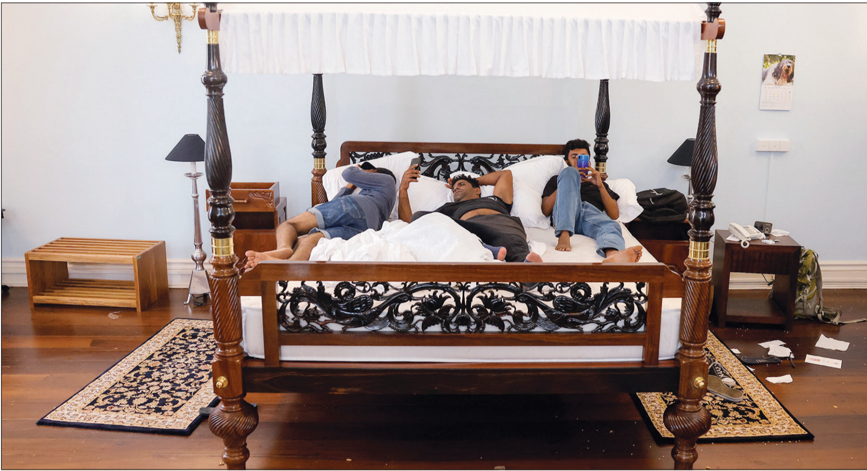
محتجون يستلقون على سرير الرئيس السريلانكي الغار جوتابايا راجابكسا

في هذه الأثناء، وصل عشرات آلاف المتظاهرين احتلال القصر الرئاسي وقصر سكرتارية الرئاسة المطل على البحر ومقر الإقامة الرسمي لرئيس الوزراء «تيمبل تريز». وقال المتظاهر ديلا بيريس «المطلب واضح للغاية، مازال الناس يطالبون باستقالة (راجابكسا) بشكل كامل ومؤكّد خطياً». وتابع «لذا نأمل في أن نحصل على هذه الاستقالة من الحكومة بما في ذلك رئيس الوزراء والرئيس في الأيام المقبلة». وقال أطباء محليون إن ما لا يقل عن 100 شخص، بينهم ضباط شرطة وصحافيون، أصيبوا نتيجة الاحتجاجات. ونفى جيش سريلانكا بشكل قاطع إطلاق النار على المتظاهرين الذين حاولوا اقتحام منزل الرئيس جوتابايا راجابكسا بالعاصمة كولومبو. وقال الجيش، في بيان نشرته الحكومة السريلانكية عبر موقعها الإلكتروني، أمس تعليقا على مقاطع الفيديو تزعم بأن القوات أطلقت النار على المتظاهرين، إن «الجيش ينفي بشكل قاطع إطلاق النار على المتظاهرين، لكنه أطلق بضع طلقات نارية في الهواء والجدران الجانبية لمدخل البوابة الرئيسية لمزل الرئيس بهدف دخول المتظاهرين». وأكد الجيش أن إطلاق النار في الهواء والجدران الجانبية لا يعني أن أفراد الجيش عازمين على التسبب في أي متعمد للمتظاهرين.