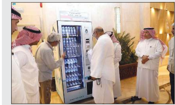
حجاج يستخدمون جهاز «بشري زمزم»

منى - واس: أطلق جهاز للخدمة الذاتية لتمكين ضيوف الرحمن من الحصول على عبوات ماء زمزم من مساكنهم مجاناً، من دون تدخل بشري من مقدمي الخدمة، حيث دشّن الجهاز الذي أطلق عليه «بشري زمزم» في 10 مواقع للخدمة في مساكن الحجاج بمكة المكرمة. ووفقاً لوكالة الأنباء السعودية «واس»