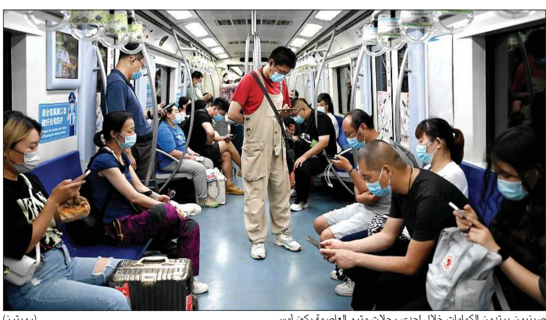
صينيون يرتدون الكمامات خلال إحدى رحلات مترو العاصمة بكين أمس

عواصم - وكالات: عاد العالم من جديد يتربق تطورات جائحة «كورونا» أمس، مع الارتفاع القياسي في عدد الإصابات، لاسيما في أوروبا وآسيا، فيما قررت قطر إلزام المواطنين والمقيمين والزائرين بارتداء الكمامات في الأماكن العامة المغلقة اعتباراً من اليوم. وذكّرت جامعة جونز هوبكنز الأميركية، في أحدث إحصائياتها، أن حصيلة الإصابات المؤكدة بـ «كوفيد-19» حول العالم ارتفعت إلى 551 مليوناً و283 ألفاً و678 إصابة، فيما ارتفع إجمالي الوفيات إلى 6 ملايين و342 ألفاً و322 حالة وفاة. وأعلن وزير الصحة الفرنسي فرانسوا برون أن حصيلة الإصابات اليومية بفيروس «ستنتخي» 200 ألف، لافتاً إلى أن الموجة السابعة من التفشي الوبائي «تشهد في الأيام الأخيرة تزايداً»، بعدد يومي بلغ نحو 120 ألف إصابة خلال الأسبوع الأخير. وبلإضافة، أمرت قبرص أمس بإعادة فرض استخدام الكمامة لمكافحة «كوفيد-19»