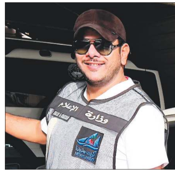
المخرج خالد الخرشان

وفن النحت والنجارة والتصوير، بالإضافة لإبرازه العديد من أصحاب الإنجازات في الحافل الخليجية والعربية والعالمية في العديد من المجالات الفنية والأدبية والرياضية والثقافية.