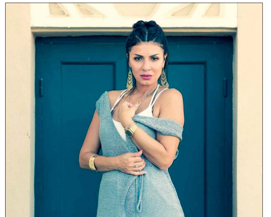
الفاهرة - محمد صلاح

تصور البعض أنه شفاف في مناطق متعددة بالجسم، تم الاحتفاء به في فيلم وثائقي عن الوضوء في مصر، احتفالاً بالذكرى العاشرة لنجاح وتطور إحدى مصمحات الأزياء في مصر، وقالت نجلاء: «أي ست تلبس الفستان يعملها شكل للجسم، وبيداري أي عيوب في الجسم». وتابعت: «أنا مش محتاجة جسمي يبقى حلو لأن الفستان هيخلي جسمي حلو، هو لوحده عامل الجسم، فأي واحدة عندها ليفوهات في جسمها لو تلبس الفستان هيعملها شكل، هي دي النقطة أنا مش محتاجة يكون جسمي حلو.. الفستان هيخليني حلوة».