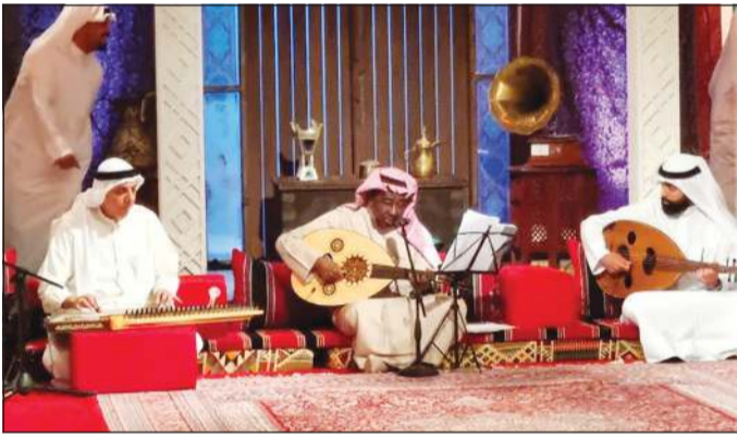
... ود. عبدالرب إدريس أثناء تصوير أغانيه

بتوجيهات من وكيل وزارة الإعلام سعود الخالدي وبمتابعة من الوكيل المساعد لقطاع التلفزيون فهد الغيلاني يواصل المخرج القدير جواهر الجوهري تصوير برنامج «البرق اليماني» وهو أول حلقاته يوليو المقبل على شاشة القناة الأولى والقضائية الكويتية. البرنامج من إعداد بدر الدعي وإشراف طلال الهيفي ويشارك فيه نخبة مميزة من المطربين الكبار والشباب مثل المطرب السعودي د.عبدالرب إدريس والمطرب عبدالعزيز السبيب والمطرب عادل الرويشد والمطرب ناصر المانع وآخرين. حضرت تصوير حلقة «الأنباء» المطرب السعودي القدير د.عبدالرب إدريس في استديو 500 والتي عبر فيها عن سعادته بالمشاركة في هذا