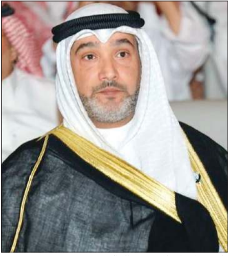
وكيل وزارة الإعلام سعود الخالدي