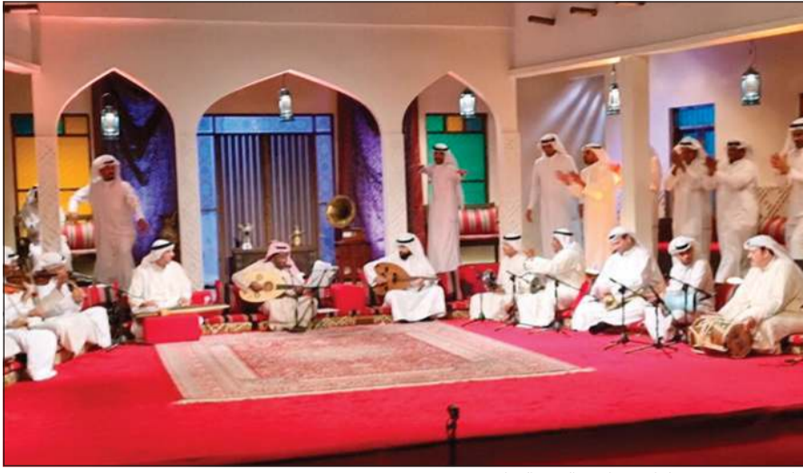
جانب من تصوير حلقات برنامج «البرق اليماني»

بتوجيهات من وكيل وزارة الإعلام سعود الخالدي وبمتابعة من وكيل التلفزيون