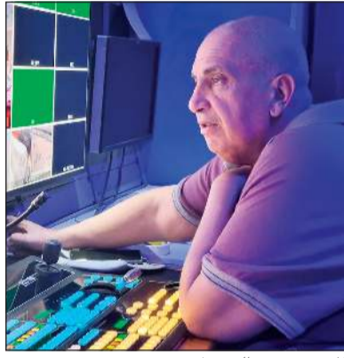
المخرج جواهر الجوهري

يذكر أن تلفزيون الكويت صور سهرة فنية مع المطرب والموسيقيار د.عبدالرب إدريس ستعرض لاحقا من تقديم الإعلامية غادة رزوقي استعرض فيها أهم مراحل حياته في الفن مطربا وملحنا.