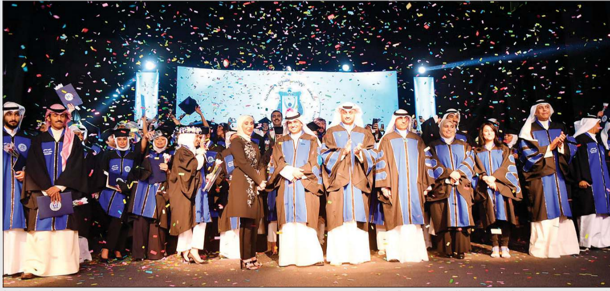
جانب من حفل تخريج طلبة المعهد العالي للفنون المسرحية دفعة 2021 - 2022