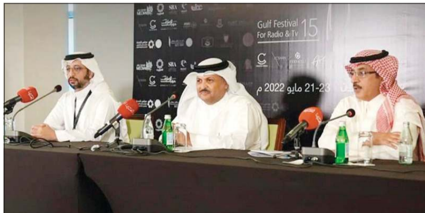
جانب من المؤتمر الصحفي