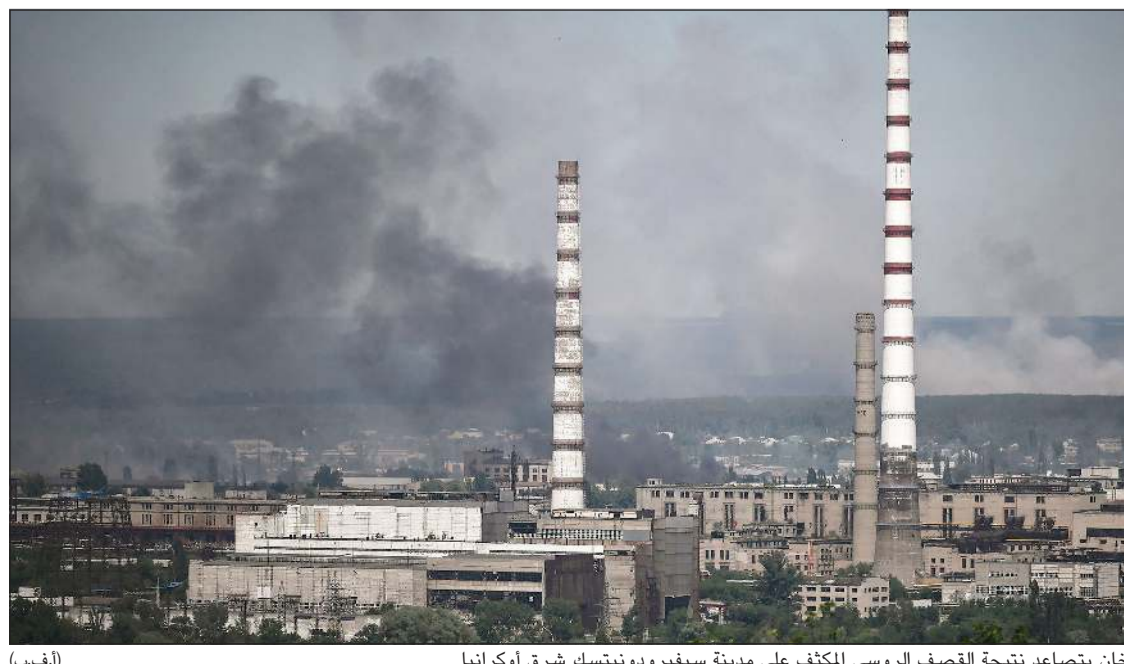
الدخان يتصاعد نتيجة القصف الروسي المكثف على مدينة سيفيروودنيتسك شرق أوكرانيا

عواصم - وكالات: دعت أوكرانيا حلفاءها الغربيين للإسراع بإمدادها بالأسلحة الموعودة وخصوصاً المدفعية الثقيلة «بعبدة المدى»، معتبرة أن هذا الأمر سيمنحها من أن تستعيد سريعاً مدينة سيفيروودنيتسك الاستراتيجية ويمكن أن تحدد المعركة مصير منطقة دونباس، وفق الرئيس الأوكراني فولوديمير زيلينسكي. وقد أكد حاكم منطقة لوغانسك سيرغي غايداي أمس أن أوكرانيا تستطيع فور حصولها على أسلحة غربية «بعبدة المدى» أن تستعيد سيفيروودنيتسك. وأشار غايداي إلى «استمرار» حرب الشوارع والقصف الروسي في المناطق الصناعية في سيفيروودنيتسك التي لاتزال تحت سيطرة الأوكرانيين. ولم تحرز القوات الروسية سوى تقدم بطيء حتى الآن ما دفع المحليين الغربيين إلى القول