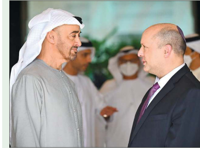
صاحب السمو الشيخ محمد بن زايد آل نهيان مستقبلاً رئيس الوزراء الإسرائيلي نفتالي بينيت في ابوظبي أمس

أبوظبي - وام: بحث صاحب السمو الشيخ محمد بن زايد آل نهيان رئيس دولة الإمارات العربية المتحدة ورئيس الوزراء الإسرائيلي نفتالي بينيت في ابوظبي امس مسارات التعاون الثنائي وفرص تنميته في مختلف الجوانب خاصة الاستثمارية والاقتصادية والتنموية بما يحقق تطلعات الجانبين نحو المستقبل. وقالت وكالة أنباء الإمارات «وام» في بيان أمس أن بينيت هذا الشيخ محمد بن زايد يتولى رئاسة دولة الإمارات العربية المتحدة، متمنياً لسموه التوفيق في قيادتها إلى ما يطمح إليه شعبها من التقدم والتنمية، وعبر عن التطلع للعمل المشترك لتوسيع آفاق التعاون خلال المرحلة المقبلة لما فيه الخير لشعوب المنطقة وأزدهارها.