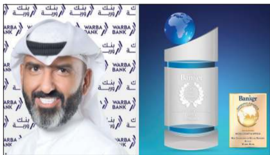
مساعداً للمزيد والجائزة

شهدت ارتفاعاً غير مسبوق في قاعدة عملاء بنك وربة الذين يستخدمون الحلول المصرفية الإلكترونية سواء عبر موقع البنك الإلكتروني أو من خلال خدمات تطبيق وربة على الهواتف الذكية، لافتاً إلى أن ذلك ارتبط بالنمو الكبير في عدد العمليات وبناتالي عدد العمليات المصرفية باستخدام كل القنوات التي تضاعفت خلال السنوات الأخيرة.