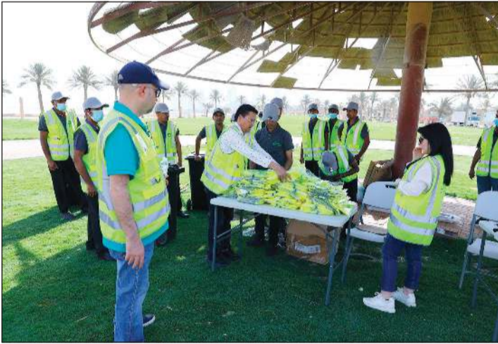
موظفو مجموعة الملا، خلال الحملة البيئية