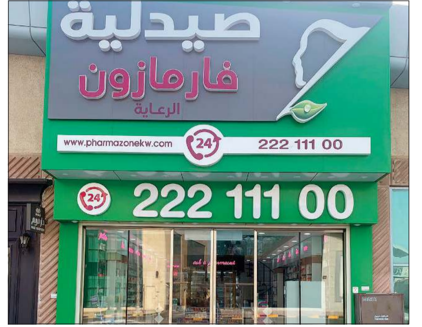
صيدلية فارمازون في جمعية الصديق