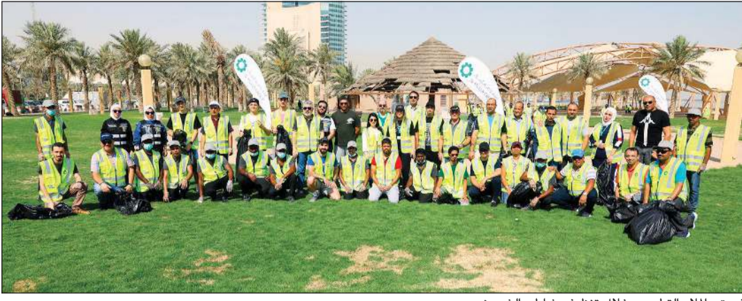
فريق «الملا» التطوعي خلال تنظيف شاطئ الشويخ

بمناسبة اليوم العالمي للبيئة وفي مبادرة تطوعية لتجسيد قيمنا الأساسية بدعم وتعزيز مشاركة موظفي مجموعة الملا في الأنشطة المجتمعية الهادفة إلى الحفاظ على صحة البيئة وبناء مجتمع أفضل، نظمت مجموعة الملا بالتعاون مع الهيئة العامة للبيئة في الكويت يوماً تطوعياً لموظفيها للمساهمة في المحافظة على نظافة الشواطئ، حيث أقيمت هذه المبادرة المشتركة يوم السبت 4 يونيو 2022 على شاطئ عام في منطقة الشويخ. ولأقت هذه المبادرة للمسؤولية الاجتماعية إقبالاً كبيراً من العديد من موظفي مجموعة الملا، حيث شهدت مشاركة زملائنا من مختلف قطاعات المجموعة، كقطاع السيارات وشركة الملا الهندسية، وشركة الملا للصيرفة.