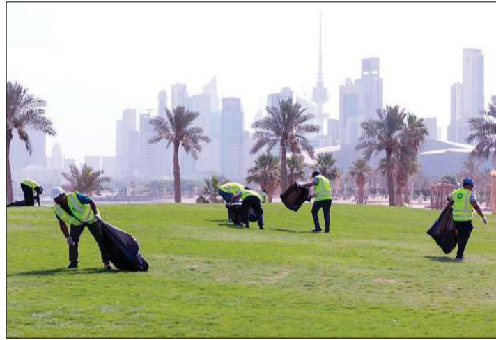
مشاركة من الجميع