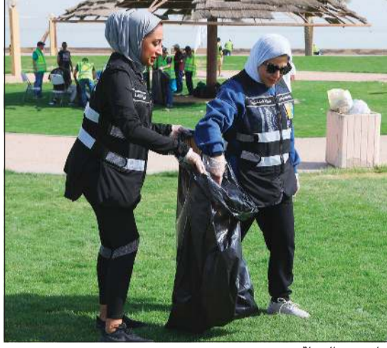
جانب من الحملة