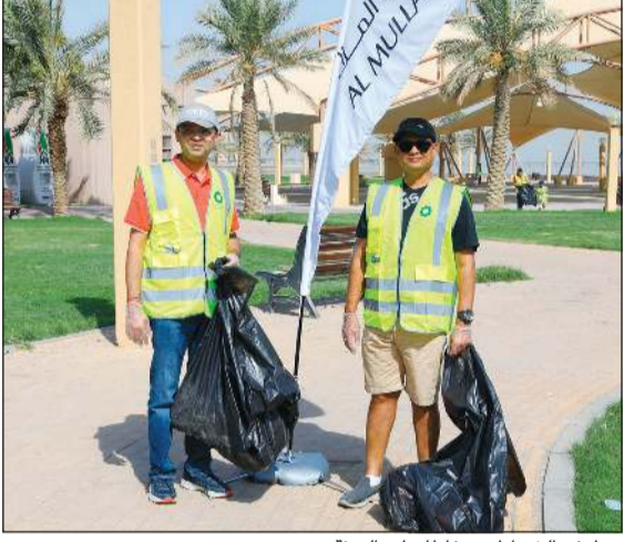
تنظيف الشواطئ حفاظاً على البيئة

وشركة الملا للتمويل، وشركة الملا للإجارة والتأجير وغيرها من القطاعات ضمن المجموعة بالتعاون