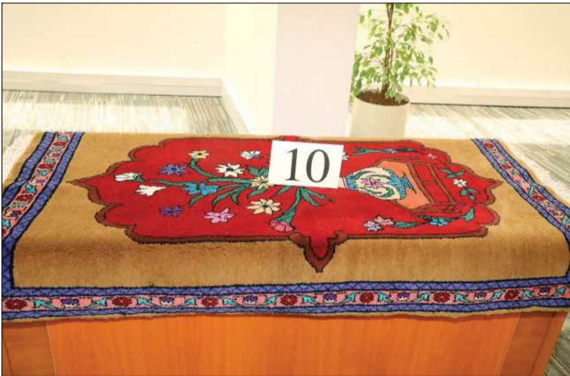
سجادة من بين السجاد المصنوع يدوياً