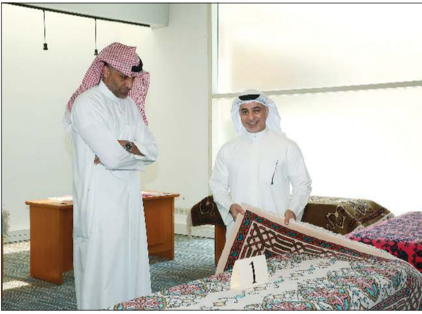
إقبال على شراء السجاد

الاساسية. وقال العمر: في ظل هذه الظروف كانت الكويت بقيادةها وشعبها عوناً للكثيرين بغض النظر عن العرق والدين وخارج حدود الجغرافيا، حتى أطلقت عليها الأمم المتحدة مسمى «مركز العمل الإنساني»، مضيفاً جمعنا اليوم حب الخير والأهداف السامية، ونتمنى أن ينجح المعرض والمزاد الخيري في بيع نحو 18 سجادة نسجتها أيادي نازحات سوريات، من أخوات لنا في الإنسانية والدين والعروبة أجبرتهم الظروف القاسية التي ضربت بلادهم منذ أكثر من 11 سنة توالى فيها الحروب والأزمات الصحية والإنهيار الاقتصادي، مما أدى بهم إلى اللجوء إلى دول الجوار لتوفير أبسط مقومات الحياة لأسرهم.