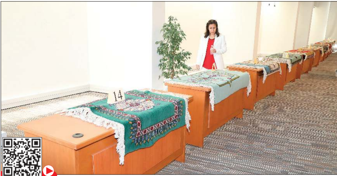
جانب من السجاد المعروض خلال المزاد الخيري (زين علام)

لا يجوز لعضو الهيئة الأكاديمية والمساعدة الجمع بين العمل بجامعة الكويت وجامعة أخرى