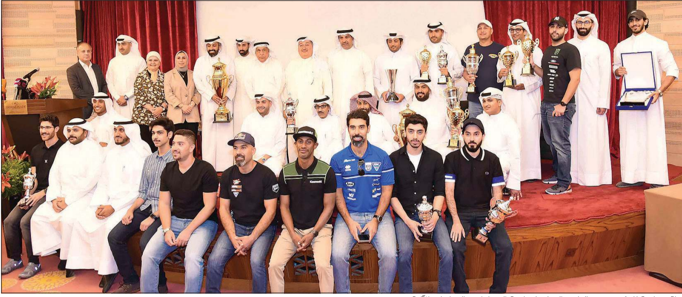
لقطة جماعية للمكرمين من النادي الدولي لرياضة السيارات والدراجات الآلية