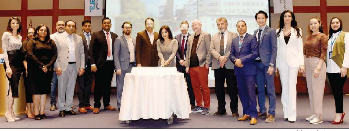
صورة جماعية للمشاركين في المؤتمر

يمكن للسياح في مقاطعة سالزبورغ استكشاف مناخ الملح القديم وقلاع القرون الوسطى أيضاً أعلى قمم النمسا وأكبر الأنهار الجليدية. وتجمع مقاطعة النمسا العليا بين المدن التاريخية الصغيرة وتشكيلات الحجر الجيري وكرانيتيا هي المقاطعة التي تضم أكثر من 200 بحيرة تتلأأ بمناظر طبيعية تتميز بقمم عالية ووديان من حولها. ويطلق على مقاطعة ستيريا