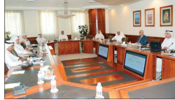
جانب من اجتماع لجنة التعليم والاقتصاد المعرفي المنبثقة عن الغرفة

عقدت لجنة التعليم والاقتصاد المعرفي المنبثقة عن مجلس إدارة غرفة تجارة وصناعة الكويت اجتماعها الرابع لعام 2022 الأربعاء الماضي، وذلك لمناقشة عدة مواضيع على أجدتها، وكان من أبرزها استعراض أهمية البحث العلمي في القطاع الخاص، حيث أنه من المعروف أن البحث العلمي يلعب دوراً مهماً في تعزيز منظومة العلم والتكنولوجيا والإبداع