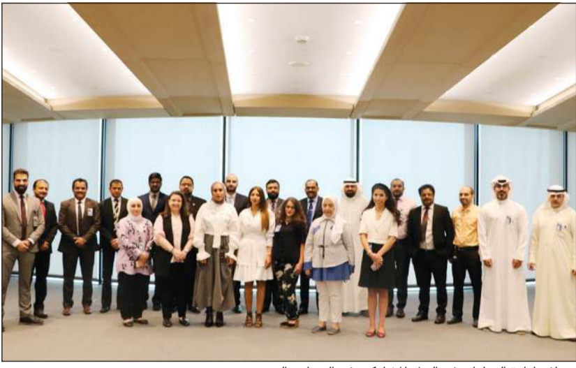
موظفو إدارة العمليات في البنك المشاركين في البرنامج التدريبي