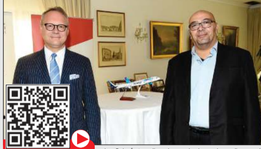
السفير النمساوي ماريان وريا مع الزميل أسامة دياب

أشاد السفير النمساوي لدى البلاد ماريان وريا بقوة ومثانة العلاقات النمساوية - الكويتية والتي وصفها بالممتازة والمتطورة على مختلف الأصعدة ومجالات التعاون نظرًا للاكتمال الهائلة التي يتمتع بها البلدان. وقال وريا، في تصريحات للصحافيين على هامش حفل الاستقبال الذي أقامه بمحل إقامته بمناسبة زيارة ممثل المكتب الوطني النمساوي للسياحة روبرت جروبلاتشر: «على المستوى السياسي: لدينا تعاون جيد على صعيد المنظمات الدولية ونيادول المشاورات حول مختلف الملفات والقضايا على الساحتين الإقليمية والدولية، أما اقتصادياً فهناك إمكانيات كبيرة لتعزيز التعاون، ولدينا لرفع معدلاته، وعلى صعيد التبادل الثقافي هناك تاريخ من التعاون المشترك، وكانت للكويت مشروعات ثقافية في النمسا،