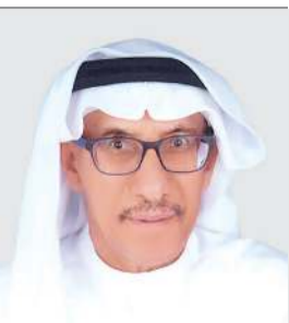
اللواء م. إبراهيم النعيمش