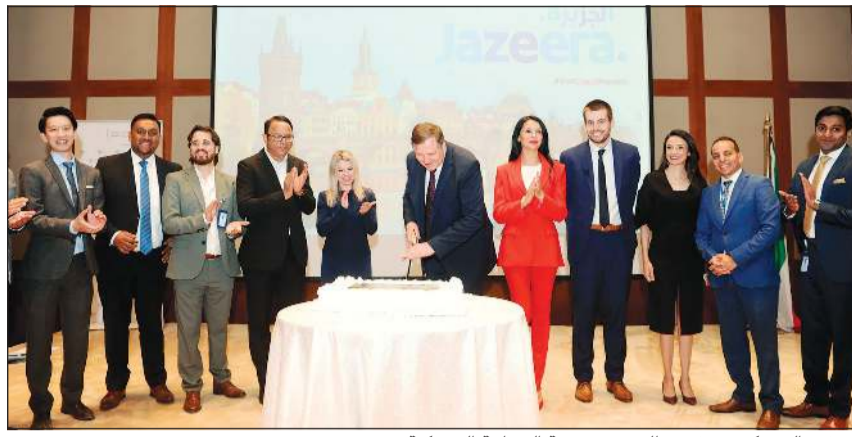
السفير التشيكي مع فريق الجزيرة وهيئة السياحة التشيكية