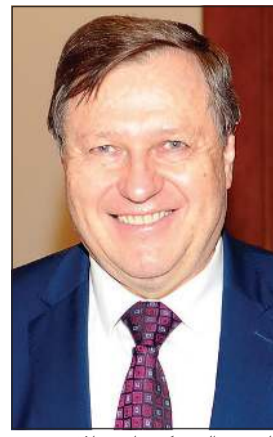
السفير التشيكي ياروسلاف سيرو

التشيكية، ماريك كروتيل: «لدى التشيك الكثير لاكتشافه بخلاف ما قد يعرفه الكثيرون من عاصمتها براغ، مما يمنح المسافرين بأنفسهم