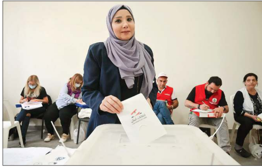
لبنانية تدلي بصوتها في الانتخابات النيابية ضمن اقتراع موظفي الإدارات العامة والأساتذة (محمود الطويل)

أنجزت امس المرحلة الانتخابية الثالثة باقتراع القضاة والموظفين الإداريين المكلفين بإدارة ورعاية المرحلة الرابعة والأخيرة من هذا الاستحقاق يوم الأحد المقبل، بموازاة الجلسة ما قبل الأخيرة، لحكومة نجيب ميقاتي في القصر الجمهوري، والتي تخللها عرض تفصيلي لانتخاب المغتربين اللبنانيين، مع تناول بعض البنود الواردة في جدول الأعمال، وترحيل الباقي إلى الجلسة الأخيرة الخميس المقبلة بعد يوم وسيطق الانتخاب الكبير. وسيطق 2300 إمام وخطيب مسجد في لبنان اليوم الجمعة دعوة دار الفتوى إلى الإقبال على الاقتراع في الانتخابات كواجب وطني. ويبلغ عدد الموظفين المكلفين بإدارة العملية الانتخابية وقرن الأصوات الانتخابية 14950 موظفاً، أي بزيادة ألف موظف عن الحاجة، تحسباً للاعتذارات أو التخلف عن الحضور يوم الأحد. ميقاتي، أكد أن السنة سيشاركون في الانتخابات ترشيحاً وانتخاباً، مبرراً عدم ترشحه، بالحرص على نزاهة هذه الانتخابات. ورأى في حديث لقناة «الحر» الأميركية، أنه لا يمكن أن يبقى لبنان، على حكومة تصريف أعمال، بأي شكل من الأشكال لأن التحديات الاقتصادية والمعيشية كبيرة، متمنياً أن يكون الشخص الذي سيكلف بتشكيل الحكومة العتيدة، برلمانياً، ضمن 27 شخصية نيابية سنية ستنتخب، وحثاً سيكون معظمها كفوئاً لترؤس مجلس الوزراء. وقال: أنا لا أدعي بأنني