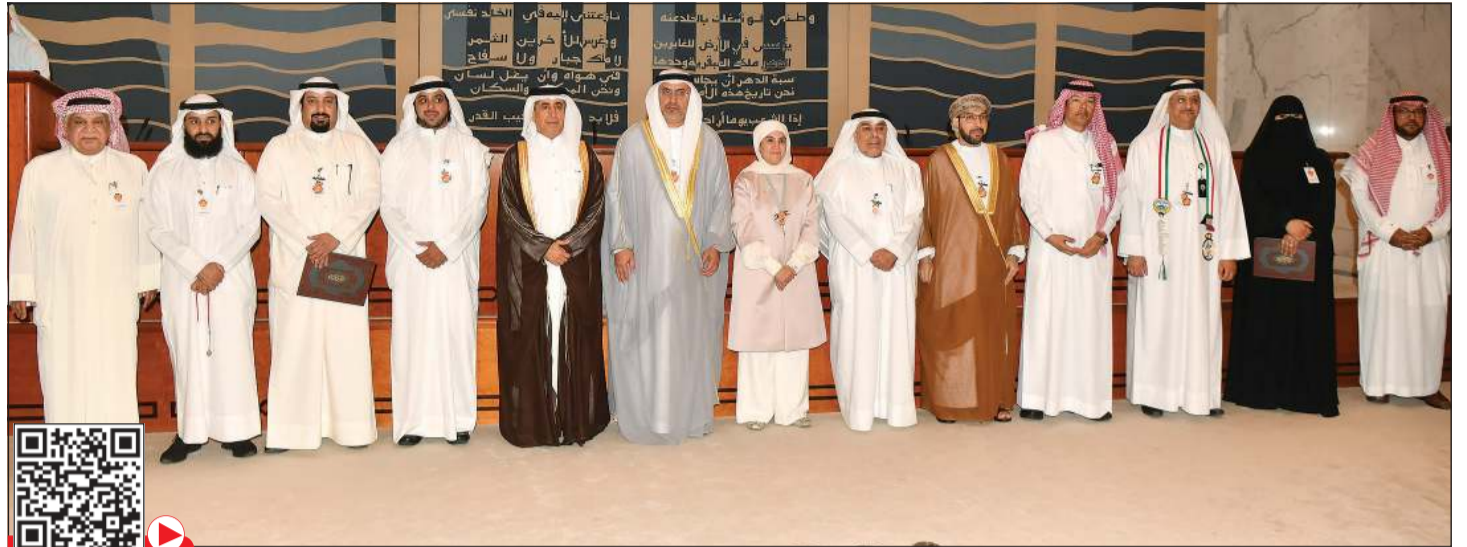
الشيخة حصة سالم الصباح متوسطة فيصل المقصيد وسفيري الإمارات وعمان وعدد من الفائزين بالجائزة (محمد هاشم)

التنموي «أتمنى» الشبيخة حصة سالم الصباح عن تاهل 20 مشاركا من دول مجلس التعاون الخليجي من المواطنين والخليجيين والمقيمين للفوز بجائزة الشبيخة حصة سالم الصباح للريادة التربوية، منشيرة الى ان 20 مشاركا من أصل 130 مشاركا آمنوا بمشروع «أتمنى» وأهدافه السامية وسعوا لتحقيقها فمن يتمنى من رواد التنمية بمختلف مجالاتها أن يساهم في تطوير المنظومة التعليمية، ويساهم في صناعة هوية التعليم العالمية والخليجية والمحلية، عليه أن يسعى لصناعة هويته الوطنية «من أنت وما هي مبادرتك»، وتحقق ذلك بفضل من الله تعالى وفضل التزامهم التام بجميع مراحل المشروع الوطني التنموي ومدتها سنة كاملة. وأضافت أن المشروع هو أول حاضنة تربوية تطوعية غير ربحية من نوعها في العالم العربي تدعم التنمية في مجال التعليم بفرصة التدريب والاستشارات لاكتساب المهارات التي تمكنهم من هذه المبادرات التربوية الرائدة كحلول مبتكرة لأصحاب القرار ليشاركوا في مواجهة تحديات العملية التعليمية وليشاركوا في تحقيق الرؤية الوطنية والخليجية والعالمية مخاطبة الفائزين: أنتم سعيتم بكل أمانة ومسؤولية واليوم جاء ليرى