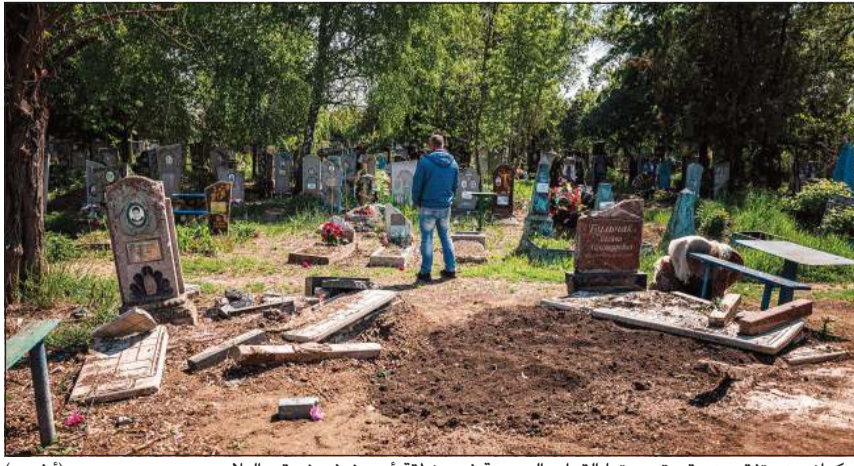
أوكرانيون يتفقدون مقبرة دمرتها القوات الروسية في منطقة أوريفيف شرقي البلاد (أ.ب.ب)

استعدت في الأيام الأخيرة أربع مستوطنات شمال خاركيف.