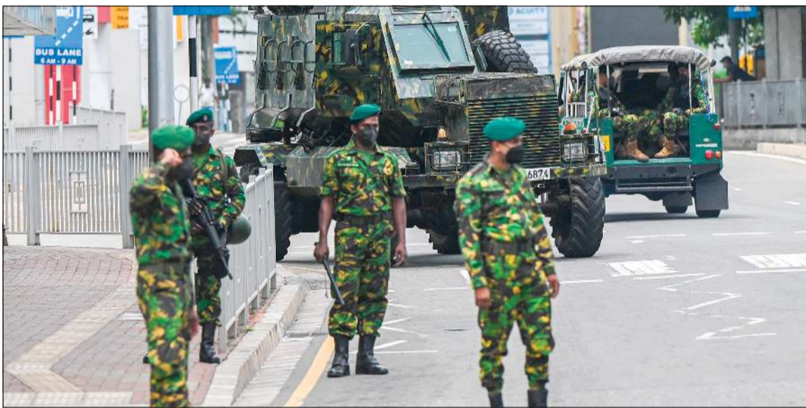
جنود يقفون في حراسة بالقرب من مركبة مدرعة عند نقطة تفتيش في العاصمة الاقتصادية لسريلانكا كولومبو (أ.ب.ب)

وجاءت هذه الخطوة بعدما اضرم محتجون النار في متحف مخصص لوالد الرئيس جونابايا راجاباكسا وشقيقه ماهيندا في معقل العائلة في الجنوب وتركو المبنى مدمراً ونهبت محتوياته أو تحطمت. وجاب أفراد من الجيش والشرطة الشوارع في مدينة ويراكيتيا الجنوبية موطن عائلة راجاباكسا، حيث أغلقت المتاجر والشركات بسبب حظر التجول الذي أعلن مسؤول بارز بوزارة الدفاع أنه قد يتم رفعه اليوم نائفاً في الوقت نفسه إن حالة الطوارئ الحالية هي خطوة بانجاه