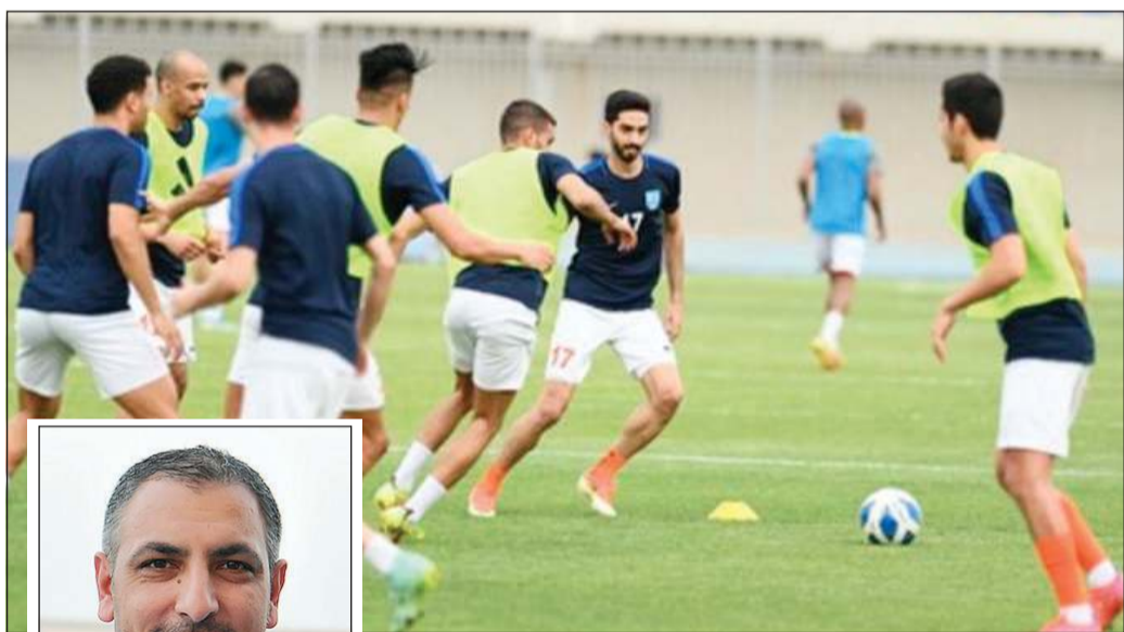
جانب من تدريب كاظمة عقب العودة من الراحة