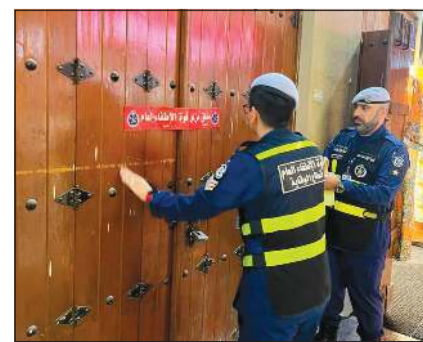
وضع ستيكر «غلق إداري» على محل مخالف في سوق المباركية

السلامة والوقاية والحريق. كما أغلقت أمس 4 منشآت في منطقتي شرق وجبله للأسباب نفسها. وقال اللواء خالد فهد إن الجولات تأتي بناء على توجيهات من رئيس قوة الإطفاء العام الفريق خالد المكراد للتأكد من استيفاء اشتراطات السلامة والوقاية من الحريق وفقاً لخطط واستراتيجيات قوة الإطفاء العام لحماية الأرواح والممتلكات لتحقيق الأمن المجتمعي.