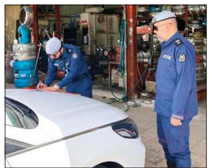
مخالفة لكراج لم تتوافر به اشتراطات الوقاية من الحريق

واصلت قوة الإطفاء العام ممثلة في قطاع الوقاية، والتي يرأسها اللواء خالد عبدالله فهد، أمس وأمس الأول حملاتها وجولاتها الميدانية لمواجهة التجاوزات والتأكد من الالتزام باشتراطات السلامة والوقاية من الحريق، حيث قام رجال الإطفاء بجولة في سوق المباركية أسفرت عن إغلاق 4 محلات لعدم اتباعها شروط