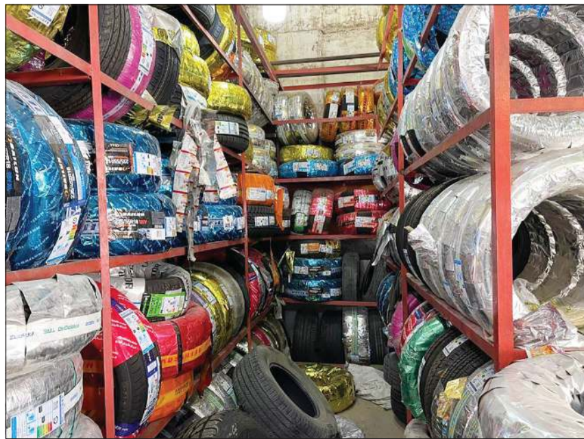
إطارات رصدت داخل كراج بشكل عشوائي

السلامة والوقاية والحريق. كما أغلقت أمس 4 منشآت في منطقتي شرق وجبله للأسباب نفسها. وقال اللواء خالد فهد إن الجولات تأتي بناء على توجيهات من رئيس قوة الإطفاء العام الفريق خالد المكراد للتأكد من استيفاء اشتراطات السلامة والوقاية من الحريق وفقاً لخطط واستراتيجيات قوة الإطفاء العام لحماية الأرواح والممتلكات لتحقيق الأمن المجتمعي.