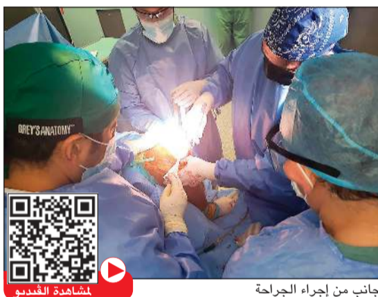
جانب من إجراء الجراحة