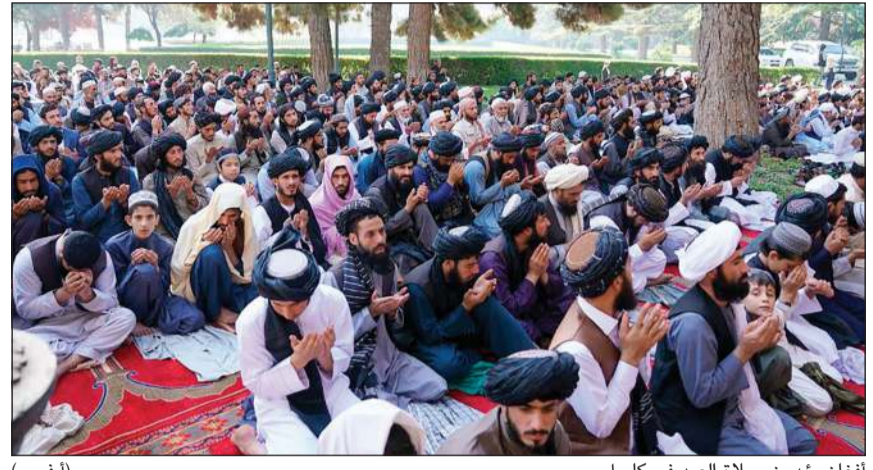
أفغان يؤدون صلاة العيد في كابول