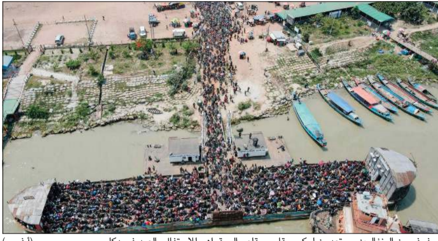
صوف من البنغاليين يستعدون لركوب قارب يقلمهم الى قراهم للاحتفال بالعيد في دكا