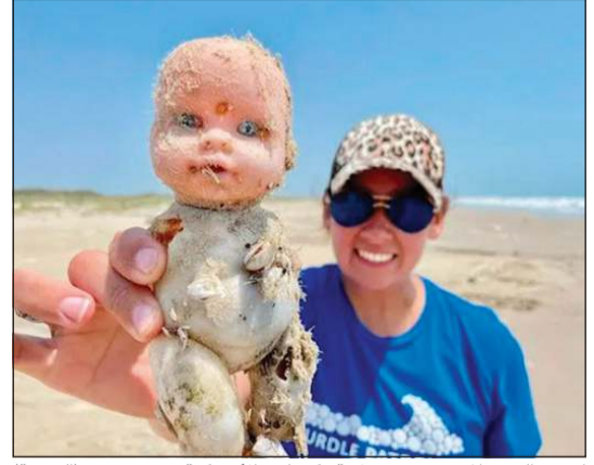
إحدى الدمى المنتشرة في ولاية تكساس الأمريكية (العربية)

وكالات: بعد أن ظهرت لأول مرة قبل أكثر من سنة، عادت الدمى المخيفة للظهور على شاطئ تكساس في أميركا مما تسبب بنوبة فرح لدى السكان الذين تخوفوا من أن تكون هذه الدمى «مسكوة»، وفقاً لـ «العربية نت». وقال العلماء الذين يزورون شاطئ تكساس الأميركي بانتظام للبحث عن السلاحف والطيور البحرية وأنواع الطيور المهدة بالانقراض، إنهم عثروا على أكثر من 30 دمى مخيفة في المكان، بحسب ما ذكرت صحيفة «ميروز» البريطانية. وأوضح العلماء الذين يقومون بأبحاث في أحد شواطئ المدينة، أنهم شعروا بالفرح بعد العثور على عشرات الدمى، التي تستمر بالظهور على نفس الشاطئ دون معرفة مصدرها. وقال جيس تونيل، من معهد العلوم البحرية بجامعة تكساس، إنهم يزورون الشاطئ مرتين في الأسبوع، ويقوم الفريق بتمشيط 40 ميلاً من الخط الساحلي، وفي كل مرة يعثرون على الدمى.