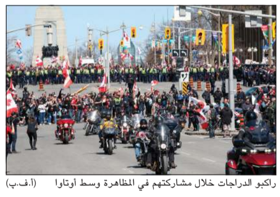
راكبو الدراجات خلال مشاركتهم في المظاهرة وسط أوتاوا

أوتاوا - أ.ف.ب: تجمع العديد من سائقي الدراجات النارية الكنديين في العاصمة أوتاوا للاحتجاج «دفاعاً عن الحرية» في تظاهرة أطلق عليها «مسيرة الرعد المتدرج»، في حركة تذكر يقاولة سائقي الشاحنات المعارضين للإجراءات الصحية في الشتاء الماضي، وقد نشرت الشرطة تعزيزات وأوقفت بعض المشاركين. وتجمع متظاهرون راجلين أمس الأول قرب النصب التذكاري للحرب في وسط المدينة، وكان العديد منهم يلغون اكتافهم بالعلم الكندي. وأشارت مصادر صحافية إلى تحليق طائرات مسيرة فوق الحشود صباح السبت وسط انتشار كثيف للشرطة. وشهد بين المتظاهرين محاربون قدامى يعلقون ميداليات عسكرية على ستراتهم، وكان عناصر شرطة وجيش سابقون قد ساعدوا سائقي الشاحنات في تنسيق اعتصامهم في الشتاء الذي استمر أكثر من ثلاثة أسابيع وشل وسط أوتاوا قبل أن تحلهم قوات الأمن بموجب سلطات طوارئ منحتها لها الحكومة الفيدرالية. لكن مطالب سائقي الدراجات ليست واضحة، ويقول العديد منهم على الإنترنت إنهم يتظاهرون «دفاعاً عن الحرية»، بينما يعارض آخرون بشدة رئيس الوزراء جاستن ترودو وسياساته.