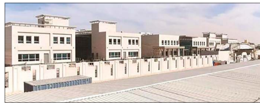
جانب من المشروع