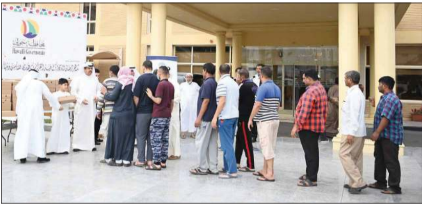
محافظ حولي وموظفو المحافظة خلال توزيع وجبات الإفطار

الاجتماعي والذي من شأنه نشر مفاهيم المودة والأمن والأمان. وقد أطلقت محافظة حولي هذه الحملة في بداية شهر رمضان للتبرع بما يقارب الـ 150 وجبة يوميا والتي تمت زيادتها لاحقا، حيث استمرت طوال هذا الشهر المبارك.