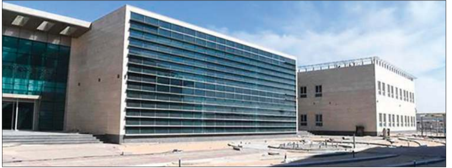
مبنى الإدارة العامة لأمن المنشآت