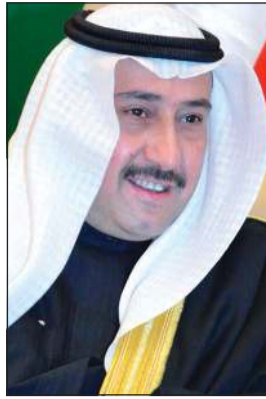
الشيخ فيصل الحمود

دعا المستشار في الديوان الإميري الشيخ فيصل الحمود رواد المجمعات التجارية خاصة بعض الشباب والنشء لضرورة الالتزام بالآداب العامة وأن يكونوا على قدر المسؤولية عبر التحلي بالسلوكيات الأخلاقية الحسنة البعيدة عن المشاحنات والمشاجرات والمظاهر السلبية الممتثلة في الرعونة والاستهتار أثناء قيادة السيارات والتي تتسبب في إغلاق الطرق، فضلا عن وقوع أضرار خاصة ونحن على أعتاب عيد الفطر المبارك والتي من شأنها إفساد مظاهر الاحتفال بهذه الأيام المباركة. وطالب الحمود الشباب بأن يقدموا نموذجا إيجابيا في التحلي بالأخلاق الحميدة والاستمتاع بالعيد بعيدا عن أي مشكلات والحفاظ على الاستمرار بالالتزام