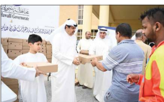
جانب من توزيع وجبات الإفطار على الصائمين

الاجتماعي والذي من شأنه نشر مفاهيم المودة والأمن والأمان. وقد أطلقت محافظة حولي هذه الحملة في بداية شهر رمضان للتبرع بما يقارب الـ 150 وجبة يوميا والتي تمت زيادتها لاحقا، حيث استمرت طوال هذا الشهر المبارك.