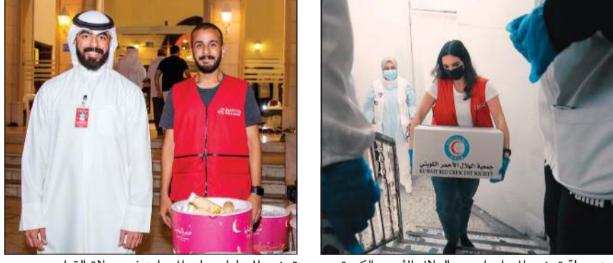
من حملة توزيع المساعدات مع الهلال الأحمر الكويتي