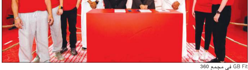
GB Fit في مجمع 360