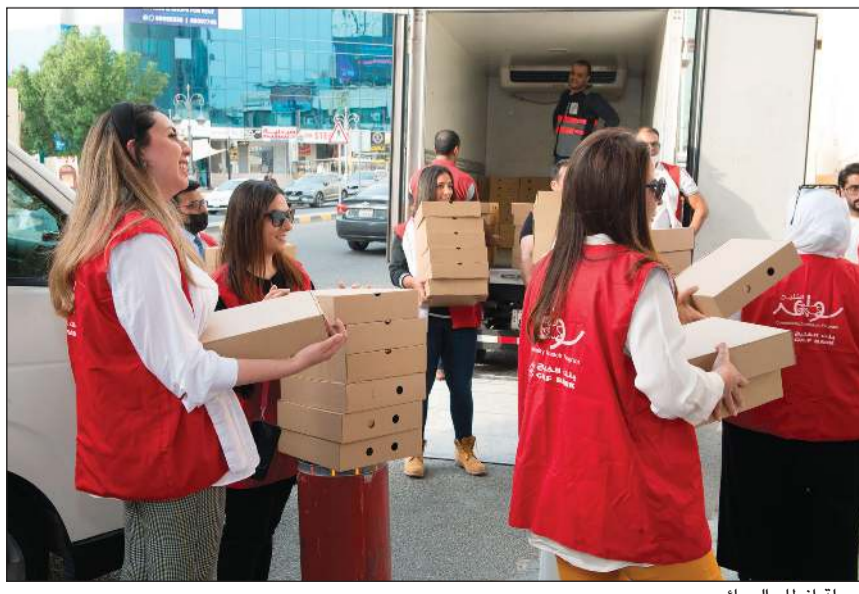
حملة إغاثة الصائم