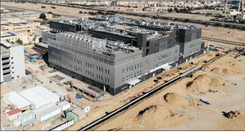
عمليات بناء المستشفيات في الأحمدى والجهراء متواصلة بمعدلات إنجاز متسارعة تمهيدا لتسليمها بنهاية 2022

بالتوازي مع استكمال عمليات البناء، بدأت أعمال تجهيز مستشفيات ضمان من خلال اختيار الأجهزة والمعدات الطبية وخطة تطبيق الرعاية الصحية الذكية وإنجاز خطة