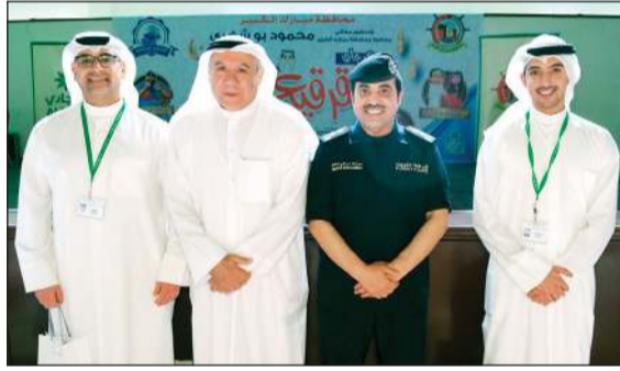
محافظة مبارك الكبير وقيادات أمنية مع فريق قطاع التواصل المؤسسي في البنك