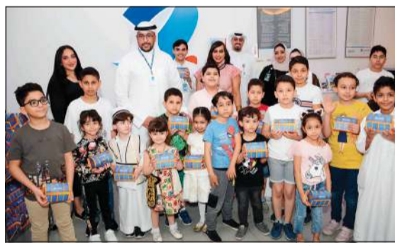
فريق بنك برقان أدخل الفرحة على الأطفال بالقرقيعان