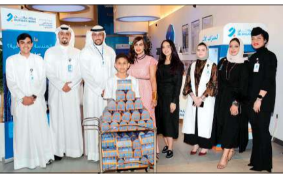
فريق بنك برقان أثناء حفل القرقيعان في فرع الأفتنيوز

ومؤسسات. ويمتلك بنك برقان مصارف تابعة مملوكة للأغلبية في منطقة الشرق الأوسط وشمال أفريقيا وتركيا تمثل مجموعة بنك برقان وتشمل بنك الخليج الجزائر - (الجزائر)، والمؤسسات المالية. ويحتل بنك برقان مركزاً ريادياً في القطاع المصرفي الكويتي باعتباره ثالث أكبر بنك من حيث الأصول، كما يقدم خدمات مصرفية مبتكرة تتناسب مع قاعدة عملائه المتنامية من أفراد وشركات