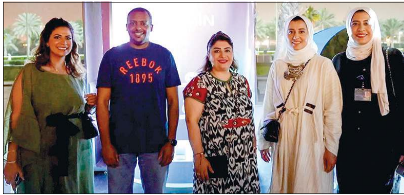
فريق زين خلال الفعالية»

الشركة نشرت البهجة والفرحة في «مروج» وحديقة الشهيد