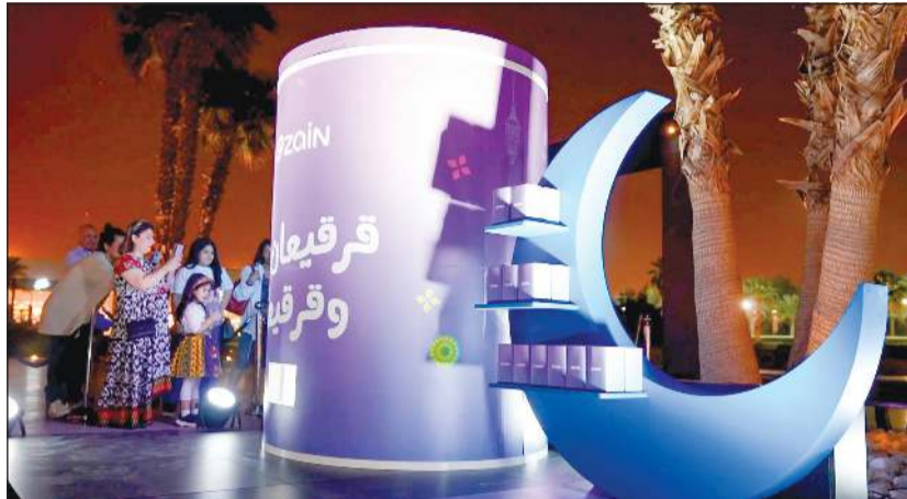
«قرقيعان زين رسم البهجة على وجوه الأطفال»

اغنية القرقيعان، وذلك محاكاة للتقاليد الشعبية الجميلة التي يحتفي بها الشعب الكويتي لكن في إطار تكنولوجي متجدد وفريد من نوعه. وتضمن الحفل العديد من الفقرات التفاعلية التي أدخلت البهجة على قلوب الأطفال وعائلاتهم، بالإضافة إلى توزيع القرقيعان الذي قدمته زين لرسم الابتسامة على وجوههم، وذلك ضمن مساهماتها الاجتماعية والإنسانية التي استمرت طوال شهر رمضان المبارك بهدف تعزيز روح التواصل وترسيخ القيم الدينية السامية في المجتمع الكويتي. وتحرص زين على تعزيز جسور اتصالها مع عملائها والمجتمع الذي تعمل فيه طوال العام، وبالأخص خلال شهر رمضان المبارك، حيث لطالما سعت إلى ترسيخ مفهوم الاستدامة بشكل عملي من خلال تكثيف برامجها في الشهر الفضيل، وذلك باعتبارها من المؤسسات الاقتصادية الرائدة في القطاع الخاص الكويتي التي تؤمن أن لديها رسالة والتزامات حقيقية تجاه المجتمع.