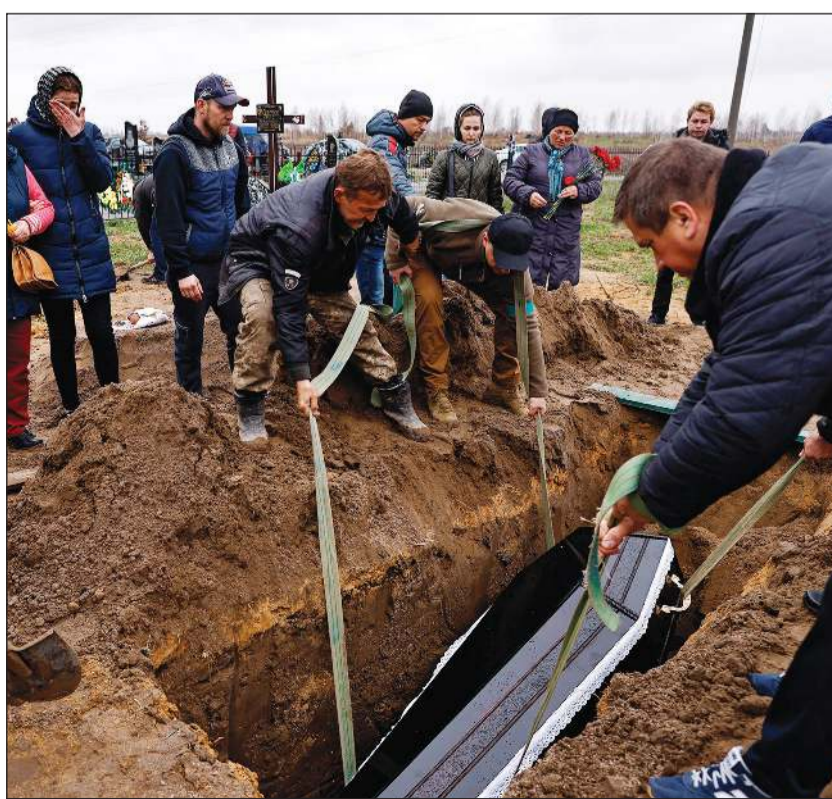
أوكرانيون يدفنون قريتهم الذي قتل بقصف روسي على بوتشا

محيط كيبف منذ إطلاق الغزو الروسي في 24 فبراير. في هذه الأثناء، يستمر الدعم الغربي للحكومة الأوكرانية بأشكال متعددة، حيث وصل رئيس الوزراء الإسباني بيدرو سانشيز مع نظيرته الدنماركية ميتي فريديريكسن صباح أمس إلى كيبف للاجتماع بالرئيس الأوكراني فولوديمير زيلينسكي، وفق ما أعلنت الحكومة الإسبانية. من جهتها، أضافت بريطانيا أمس 26 فرداً وكياناً لقائمة المشمولين بعقوبات على روسيا بما يشمل قادة عسكريين وشركات دفاعية. ومن بين من تم إدراجهم حديثاً في قائمة العقوبات، التي نشرتها الحكومة على موقعها الإلكتروني على الإنترنت، الكولونيل جنرال نيكولاي بوغدانوفسكي من الجيش الروسي ويشغل منصب النائب الأول لرئيس الأركان المشتركة وكذلك شركة الصناعات العسكرية ومجموعة برومك-دوبنا الصناعية. في المقابل، قالت وزارة الخارجية الروسية إنها أمرت بإغلاق قنصليات لاتفيا وليتوانيا وإستونيا وطلبت من الموظفين فيها المغادرة بعد خطوات مماثلة من الدول الثلاث. وأضافت الوزارة في بيان أنها ستغلق قنصليتها لاتفيا في سان بطرسبرغ وبسكوف وقنصليتها إستونيا في سان بطرسبرغ ومكتبها في بسكوف وقنصليتها ليتوانيا في سان بطرسبرغ. وفي وقت سابق من هذا الشهر، أمرت لاتفيا وإستونيا بإغلاق قنصليات روسيا بسبب غزوها أوكرانيا بينما طلبت ليتوانيا من السفير الروسي المغادرة.