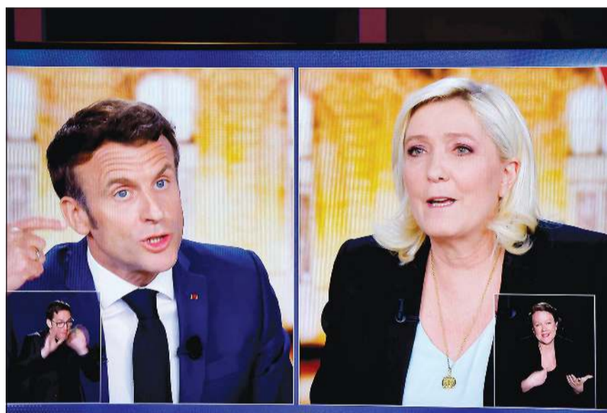
صورة عن التلفزيون لمتنافسين إيمانويل ماكرون ومارين لوبن خلال المناظرة التلفزيونية أمس الأول

«أدعم أوكرانيا حرة لا تتبع لالولايات المتحدة ولا للاتحاد الأوروبي ولا لروسيا، هذا هو موقفي». واتهم ماكرون اليمينية المتطرفة بالمخاطرة بإشعال «حرب أهلية» في فرنسا في حال تم انتخابها ونفذت تعهدها بحظر الحجاب في الأماكن العامة، لكن ذلك لم يمنحها من تأكيد تمسكها بفكرتها المثيرة للجدل بشأن حظر الحجاب الذي اعتبره «زياً موحداً فرضه الإسلاميون». ورد ماكرون عليها بالقول «ستتسبب في إشعال حرب أهلية. أقول ذلك بصدق». وقال «إنك تدفعين الملايين من مواطنينا إلى خارج الفضاء العام»، معتبراً أن ذلك سيكون «قانوناً نبيذ»، لكن لوبن ردت قائلة إنه سيكون «قانوناً للدفاع عن الحرية». وأضاف «فرنسا، موطن التنوير والكوكبية، ستصبح أول دولة في العالم تحظر الرموز الدينية في الأماكن العامة. هذا ما تقترحينه، وهو غير مقبلي». وأردف ساخراً من منافسته «كم عدد الشرطين الذي تقترحينه لملاحقة من يضع الحجاب أو الكعباءة أو