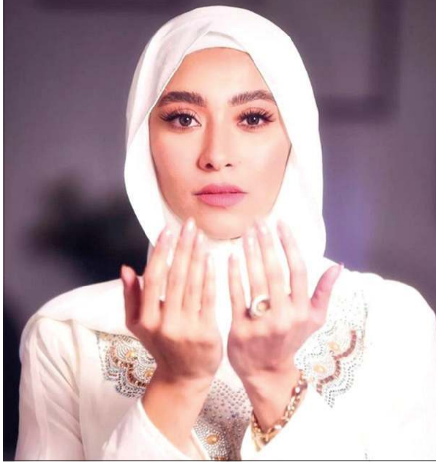
زيدي عادل مرتدية الحجاب

فاجأت زيدي عادل، المطربة المصرية ونجمة برنامج «ستار أكاديمي»، جمهورها أمس بإعلان اعتزالها الغناء والفن، ونشرت فيديو على حسابها بانستغرام، كشفت فيه عن تفاصيل قرارها باعتزال الغناء وأسباب اتخاذها ذلك القرار. ونشرت المطربة زيدي عادل أمس فيديو على حسابها بانستغرام أعلنت فيه قرار اعتزالها الغناء وعلقت عليه قائلة: «قرار الاعتزال»، وكشفت في الفيديو عن تفاصيل قرار اعتزالها الغناء. وقالت إنها تعتبر اعتزالها أهم خبر في حياتها وأجمل خبر كذلك، مشيرة إلى أنها اتخذت القرار منذ فترة لكنها أجلت الإعلان عنه لأنها كانت تريد الحديث مع نفسها في البداية ومع المحيطين بها قبل إعلان القرار، وكشفت عن تلقيها دعماً وتشجيعاً كبيراً من أصدقائها بعد إعلانها قرار اعتزال الغناء.