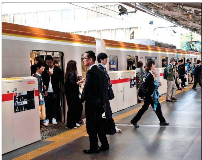
إحدى محطات القطار في اليابان

طوكيو - د.ب.أ: أمرت محكمة يابانية بإعادة مبلغ من المال إلى سائق قطار، بعد أن قامت جهة العمل التي يعمل لديها بخصم المبلغ من راتبه بسبب تأخره لمدة «دقيقة واحدة»، وبذلك سيستعيد السائق ما يعادل 44 سنتاً أميركياً، إلا أنه لم يعش ليشهد الحكم لصالحه في المحكمة. وذكرت صحيفة «يوميوري شيمبون» اليومية أن المحكمة الجزئية في مقاطعة أوكاياما قضت أمس بأن تدفع شركة «ويست جابان» للسكك الحديدية، 56 ينا للسائق الذي توفي في وقت سابق هذا العام. ويشمل المبلغ مقابل ما دأباً لم يحصل عليه، عن عمل إضافي قام به. وكان من المفترض أن يستقل السائق قطاراً خاوياً إلى محطة في أوكاياما عام 2020، إلا أنه ارتكب خطأ في البداية على الرصيف، مما تسبب في تأخير موعد مغادرة القطار بدقة واحدة، وكعقوبة، تم خفض أجره بواقع 43 ينا، فقام السائق بإحالة الأمر إلى المحكمة.