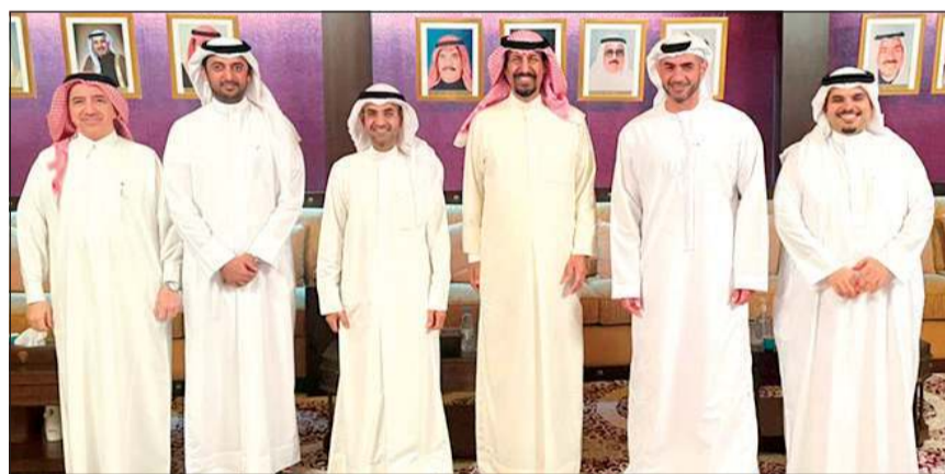
السفير الشيخ علي الخالد ود. نايف الحجرف مع السفراء الحضور

الروحانية مؤكداً ان الالتقاء مهم جدا خاصة بما يعزز علاقات السلك الدبلوماسي والدولة المضيفة المملكة العربية السعودية وهو امتداد لعاداتنا وتقاليدينا الأصيلة. وأضاف السفير السحلي ان هذا اللقاء مهم خاصة بعد الانقطاع بسبب جائحة فيروس «كورونا» ومع بداية الانفراج وعودة الأمور إلى طبيعتها في الالتقاء والاجتماع وتبادل الآراء لافتاً الى الحاجة له في هذا الوقت وهي المبادرة الطيبة التي قام بها السفير الشيخ علي الخالد بهذه السنة الحسنة التي سنها سفراء دول مجلس التعاون والدول العربية.