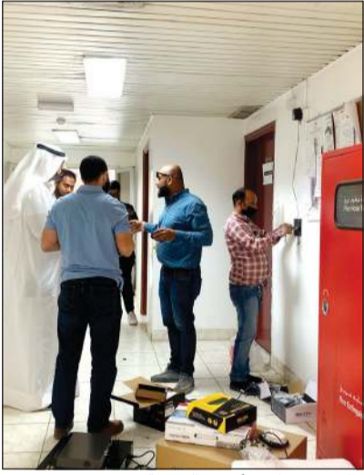
جانب من تركيب اجهزة البصمة