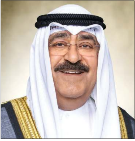
سمو ولي العهد الشيخ مشعل الأحمد بقرص

استقبل سمو ولي العهد الشيخ مشعل الأحمد بقرص ببيان صباح أمس رئيس مجلس الأمة مرزوق الغانم. كما استقبل سمو ولي العهد سمو الشيخ صباح الخالد رئيس مجلس الوزراء. واستقبل سمو ولي العهد نائب رئيس مجلس الوزراء ووزير الدفاع الشيخ طلال الخالد. كما استقبل سمو ولي العهد نائب رئيس مجلس الوزراء ووزير النفط والغاز الدكتور محمد الفارس.