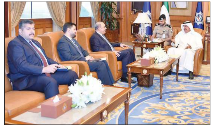
الفريق أول متقاعد الشيخ أحمد النواف مستقبلاً السفير العراقي

وزير الداخلية سفير جمهورية العراق الشقيقة لدى البلاد المنهل الصافي. ورحب بضيوفه وتم بحث عدد من الموضوعات ذات الاهتمام المشترك وسبل دعم وتعزيز العلاقات الأمنية بين البلدين الشقيقين. وأعرب السفير العراقي عن تقديره وشكره للكويت على ما تقدمه من جهود فعالة مخصصة للحفاظ على الأمن والاستقرار في المنطقة. كما استقبل النائب الأول لرئيس مجلس الوزراء وزير الداخلية الفريق أول متقاعد الشيخ أحمد النواف سفير الجمهورية التونسية الشقيقة لدى البلاد الهاشمي عجيلي، وأشاد بالعلاقات التاريخية المتميزة بين البلدين الشقيقين، ثم استعرضا عددا من الملفات التي من شأنها دعم تعزيز سبل التعاون والتنسيق الأمني بين الكويت والجمهورية التونسية.