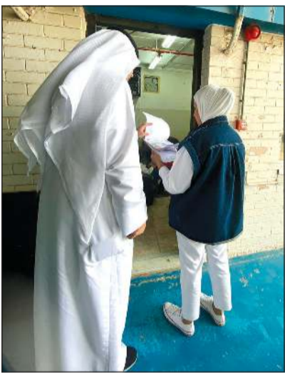
متابعة عملية تركيب الاجهزة