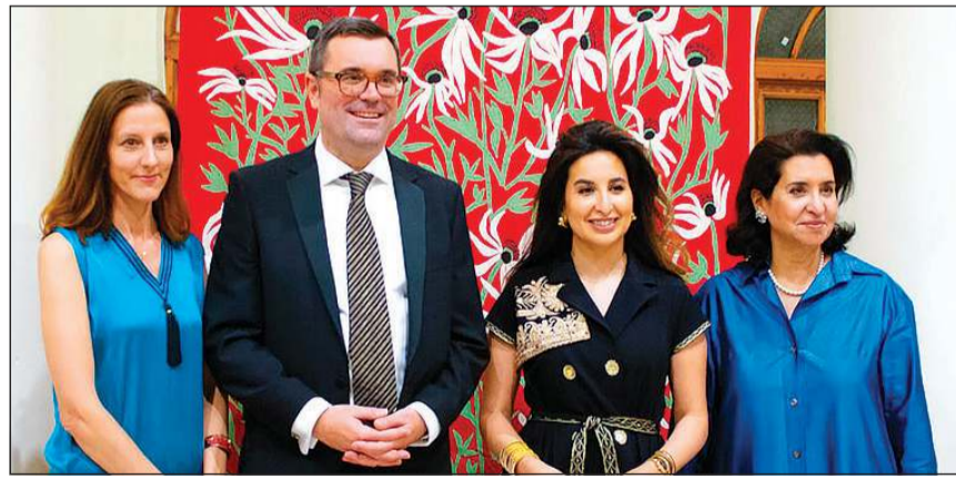
السفير الأسترالي جونان غيلبرت وعقبته والشيخة بيبي الصباح والشيخة أطفاف الصباح

قطعهن التكميلية للاحتفاء هذه القطع قصص حياتهن وتاريخهن، إلى حد كبير بنفس الطريقة التي يروي بها السدو قصة الكويت، وفرحون بالمشاركة والتعاون مع فنانات ومصممت كويتيات يستخدمن هذه الأقمشة في