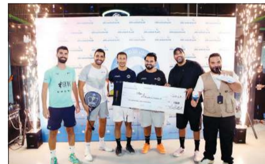
الفريق الفائز بالبطولة الأولى متسلماً للجائزة