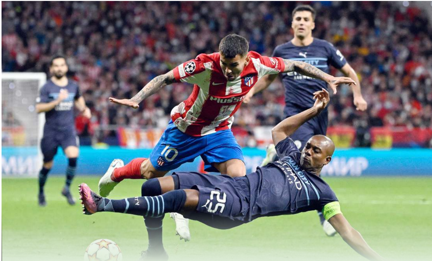
مان سيتي وليفربول يلحقان بريال مدريد وفاريال في نصف نهائي المسابقة القارية العريقة