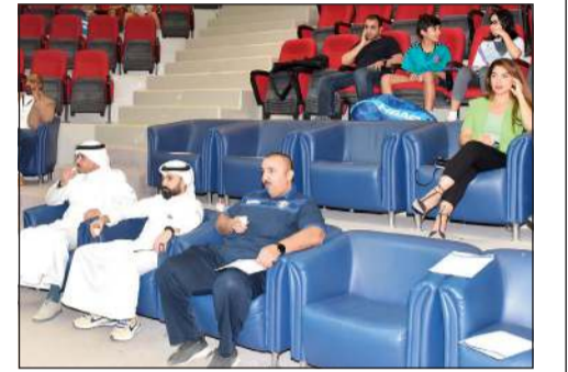
جانب من حضور المؤتمر

شاركت كلية الكويت للعلوم والتكنولوجيا في المؤتمر الصحافي لبطولة الكويت الرمضانية المفتوحة للإسكواش 2022 في نسختها الأولى، الذي عقد الأحد الماضي 10 إبريل في مقر اتحاد الإسكواش. وستقام البطولة على ملاعب اتحاد الإسكواش في الفترة من 13 إلى 18 رمضان من الساعة 8:30 مساءً إلى 12:30 صباحاً. بمشاركة أكثر من 100 لاعب ولاعبة ضمن 4 فئات هي: فئة الهواة للرجال، وفئة السن العام (لاعبو الأندية المقيدون لدى الاتحاد) للرجال، وفئة النساء، وفئة المدربين للرجال. وتشترك كلية الكويت للعلوم والتكنولوجيا برعاية هذه البطولة إيماناً منها بدور القطاع الخاص بالمساهمة في