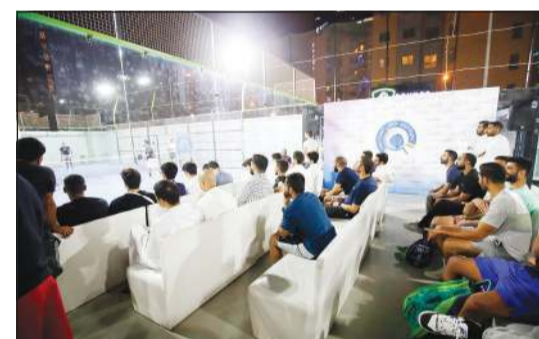
جانب من بطولة البادل التي نظمتها البنك الأهلي المتحد

نظم البنك الأهلي المتحد بطولة في لعبة البادل أقيمت يومي 8 و9 أبريل الجاري على ملعب Abou Padle، وقدم البنك جوائز نقدية للفريق الفائزة تتجاوز قيمتها 3 آلاف دينار، حيث حصل الفريق الفائز بالمركز الأول على مبلغ 1500 دينار، وحصل الفريق الفائز بالمركز الثاني على مبلغ 1000 دينار، بينما حصل الفريق الفائز بالمركز الثالث على مبلغ 750 ديناراً، كما تم تسليم الدروع التذكارية للفريق الفائز.