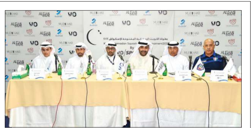
جانب من المؤتمر الصحافي لبطولة الكويت الرمضانية المفتوحة للإسكواش (أحمد علي)

تقام غداً السبت 5 مباريات ضمن المرحلة الـ 30 من الدوري الألماني، إذ يتواجه أوغسبورغ مع هرتا برلين، بوروسيا دورتموند مع فولفسبورغ، فرايبورغ مع بوخوم، ماينتس مع شتوتغارت، وبوروسيا مونشنغلاخ مع كولن.