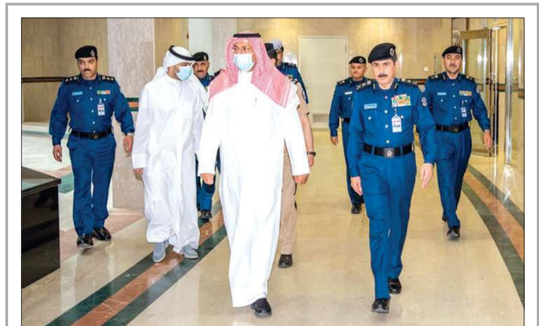
الشيخ أحمد النواف لدى وصوله إلى مبنى قوة الإطفاء العام و استقباله رئيس القوة الفريق خالد المكراد

عواصم - وكالات: انتخب البرلمان الباكستاني زعيم المعارضة شهباز شريف رئيساً جديداً للوزراء بعد يوم من الاطاحة بسلفه عمران خان بعد معركة سياسية لايتوقع ان يبدأ أوارها قريباً، خصوصاً ان نواب «حركة الأتحاف» حزب رئيس الوزراء المخلوع، قدموا استقالة جماعية من البرلمان في خطوة ستفاقم الأزمة السياسية التي تصصف بالبلاد. وقال القائم بأعمال رئيس البرلمان سردار آياز صادق: «تم انتخاب ميان محمد شهباز شريف رئيساً للوزراء»، بحصوله على 174 صوتاً من أصل 342 في المجلس، وسيتمتع على شريف الآن بتشكيل حكومة من حزبه «الرابطة الإسلامية الباكستانية» (وسط) و«حزب الشعب الباكستاني» (يسار وسط) و«جمعية علماء الإسلام» المحافظة.