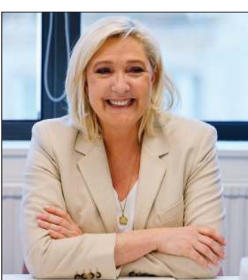
مرشحة الانتخابات الرئاسية مارين لوبن

خصوصاً أن الاستطلاعات التي أعقبت الانتخابات حول نوايا التصويت في الدورة الثانية أعطت أفضلية ضيقة لماكرون بحصوله على 51٪ من الأصوات وفق استطلاع «إيفوب - فيد و سيال»، و40٪ وفق استطلاع معهد «إيسوس»، وهي نسبة أدنى بكثير مما حصد عام 2017 (66٪). وحصل الرئيس الفرنسي المنتخبه ولايته على