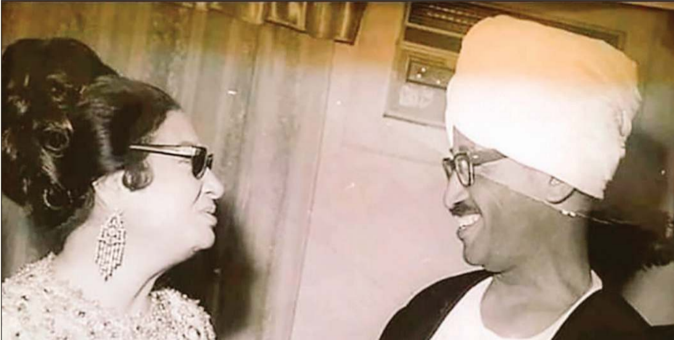
كوكب الشرق أم كلثوم في حديث باسم مع الشاعر السوداني الهادي آدم صاحب قصيدة «أعدا القاك»