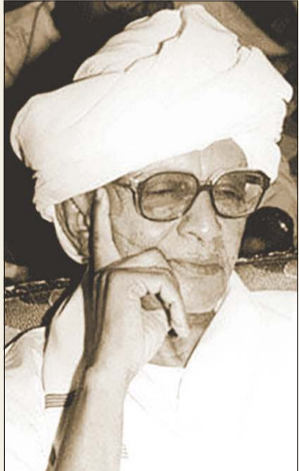
بفلم: د. يعقوب يوسف الغنيم