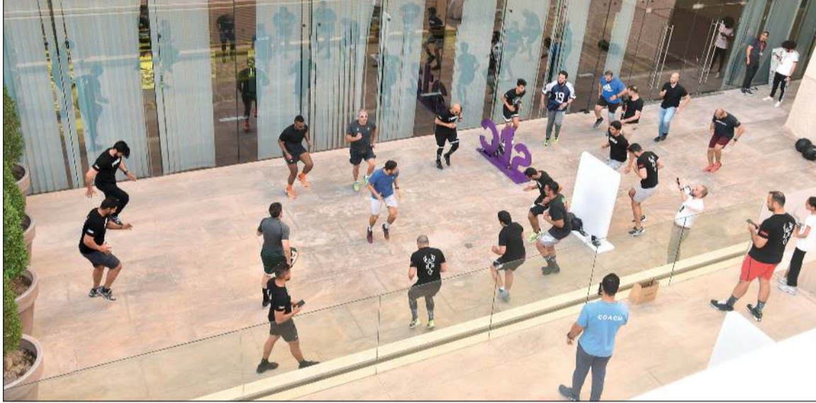
إقبال على المشاركة بحملة جدد نشاطك في برج «الحمراء»