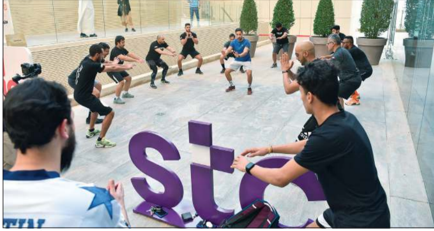
المشاركون خلال الاستعداد لمسابقة التحدي الرياضي