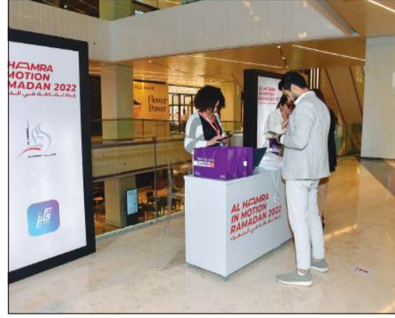
التسجيل في المسابقة