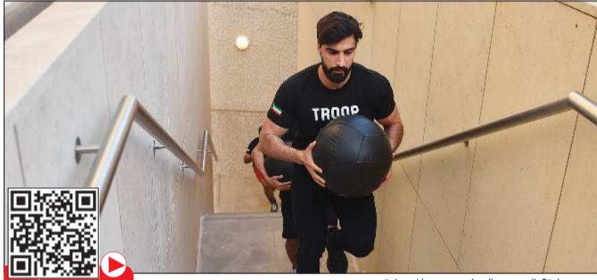
من مسابقة التحدي الرياضي بين المتسابقين

وأوضح العيسى أن الحملة هدفها التوعية بأهمية ممارسة الأنشطة الرياضية والتنظيم برعاية من بنك وربة وشركة