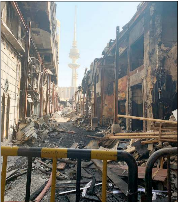
مطالبات بالحفاظ على التصميم التراثي للسوق

يجب التوقف عند تقنيات الوقاية المستخدمة ومواد البناء والأساليب الضرورية اللازمة لمنع تكرار حدوث الحرائق