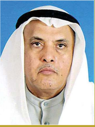
بقلم: د. يعقوب يوسف الغنيم

الإمام البخاري اعترف له علماء عصره بالدقة وصدق المنهج ومخافة الله في عمله.. والإمام مسلم اهتم بجمع الصحيح من الحديث والتنقل بين البلدان الإسلامية في سبيل ذلك