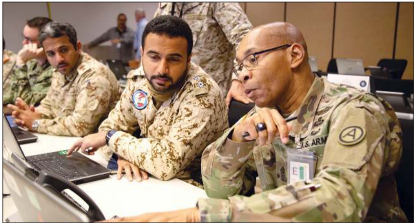
جانب من الجلسات في المؤتمر

اختتم تمرين «حسم العقبان 2022»، بنسخته الخامسة عشرة في قاعدة (فورت كارسن) بولاية كولورادو الأميركية بقيادة الجيش الكويتي ومشاركة الحرس الوطني وعدد من دول مجلس التعاون الخليجي إلى جانب الولايات المتحدة الأميركية.