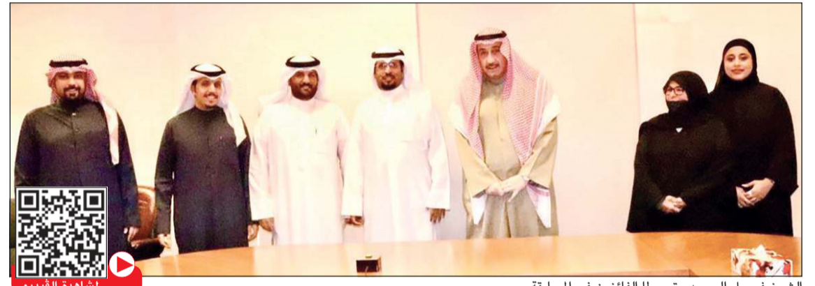
الشيخ فيصل الحمود متوسطا الفائزين في المسابقة

وأكد قائد قوة الواجب المشتركة لتمرين (حسم العقبان 2022) العميد الركن