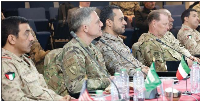
ندوة لكبار القادة العسكريين

وهويته يمتلك الأدوات الفنية والتفاني التي تمكنه من التفاعل مع ثقافات العالم بإيجابية. وأعرب الشيخ فيصل الحمود عن شكره للمنظمين لما بذلوه من جهود مشهودة حققت من خلالها المسابقة نجاحا باهرا عكس الروح الوطنية لدى جميع المشاركين، مشيرا في الوقت ذاته إلى أهمية هذه النشاطات الفنية لدى أبنائنا في خلق