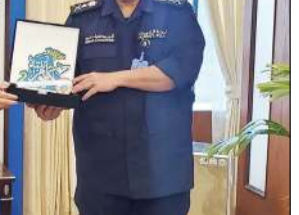
وكيل وزارة الداخلية الفريق أنور البرجس مستقبلا د. وجدان العقاب

الموسم الثامن من سلسلة البرامج حلقاتها التلفزيونية لرصد وتوثيق الحياة الفطرية في الكويت والمزعم عرضها في الدورة البراجمية لشهر رمضان المقبل. وخلال اللقاء تقدمت د. العقاب بالتهنئة للفريق البرجس على تبوئه مهام وكيل وزارة الداخلية ونيل ثقة القيادة السياسية، مشيدة بتوجهاته السديدة