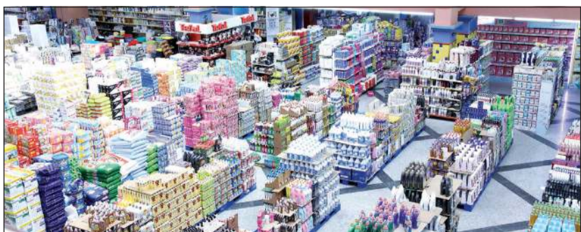
تشديد الرقابة على الأسعار

المواد والسلع والمنتجات الغذائية متوافرة بصورة طبيعية في الجمعيات التعاونية والأسواق المركزية المختلفة، مهيبا بأصحاب مراكز البيع الحرص على الالتزام بلوائح وقوانين وزارة التجارة والصناعة لكي لا تتعرض مؤسساتهم للمساءلة القانونية.