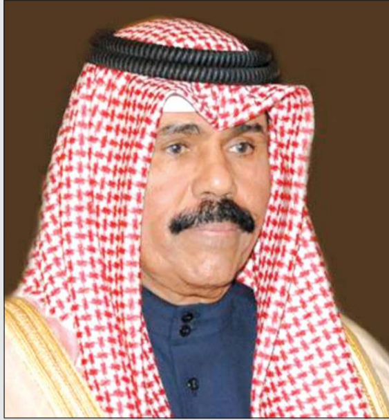
صاحب السمو الأمير الشيخ نواف الأحمد

ببرقية تهنئة مماثلة، ويعث صاحب السمو الأمير الشيخ نواف الأحمد ببرقية تهنئة إلى الرئيس مايكل دانيل هينغز رئيس جمهورية إيرلندا الصديقة عبر فيها سموه عن خالص تهنئه بمناسبة العيد الوطني لبلاده، متمنيا له موفور الصحة والسعادة ولجمهورية إيرلندا وشعبها الصديق كل التقدم والازدهار. ويعث سمو ولي العهد الشيخ مشعل الأحمد ببرقية تهنئة إلى الرئيس مايكل دانيل هينغز رئيس جمهورية إيرلندا الصديقة بمناسبة العيد الوطني لبلاده، متمنيا سموه له موفور الصحة والعافية. ويعث سمو رئيس مجلس الوزراء الشيخ صباح الخالد ببرقية تهنئة مماثلة.