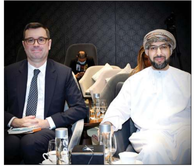
السفير العماني صالح الخروصي وسفير استراليا جوناثان غيلبرت

خلال ندوة نظّمها المركز احتفاءً بمرور 60 عاماً على بداية العلاقات الدبلوماسية بين الكويت واليابان