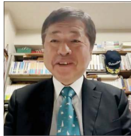
البروفيسور كانيهارا نوبوكاتسو