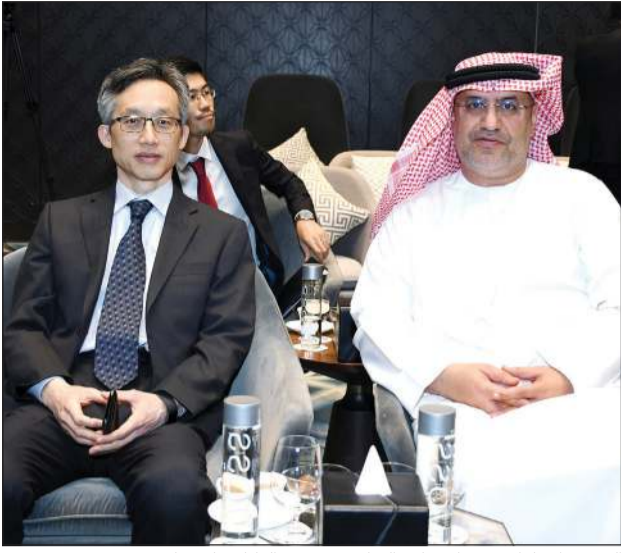
السفير الإماراتي د.محمد حامد النيايدي وسفير اليابان ياسوناري مورينو