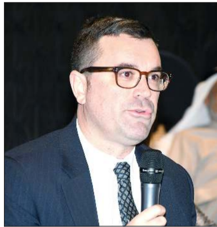
السفير الاسترالي جوناثان غيلبرت متحدثاً خلال الندوة