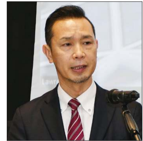
نائب السفير الياباني كانيكو كوجي يلقي كلمة خلال الندوة

عن تجهيز مخزن ضخم في إحدى الجزر اليابانية والتي يمكن أن يتم بها تخزين ما يقرب من 19 مليون برميل نطف لمواجهة أي نوع من الطوارئ. وأوضح د.سهر أن إنفاذ القانون الدولي ليس من الأمور السهلة تطبيقها، فالقانون الدولي ليس من الضروري أن يكون منطقياً، ومن يفرض القانون هو قوة الدول والمصالح الشخصية، مشيراً إلى أن الصين من الدول التي لا يمكن استبعادها من المجتمع الدولي نظراً لقوتها الاقتصادية التي فرضت هيمنتها على الدول المجاورة. وتابع: «الصين ستتحرك دائماً باتجاه مصالحها، وسنلاحظ في السنوات القادمة تغير وتلاشي بلدان القوى العظمى مثل الولايات المتحدة الأمريكية والبلدان الأوروبية، فالصين تتحرك نحو قمة الهرم الدولي، وربما في عام 2040 كحد أقصى ستكون الصين في أعلى النظام الاقتصادي الدولي»، ودعا سهر