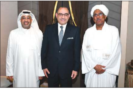
سفير السودان عبدالمنعم الأمين وسفير العراق المنهل الصافي وحسام الرشيد