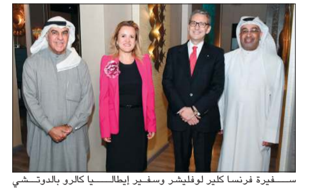
سفيرة فرنسا كلير لوفليشر وسفير إيطاليا كارلو بالدوتشي والشيخ جابر الفيصل وحسام الرشيد