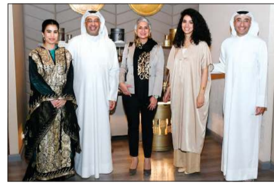
سفيرة كندا عليا مواني مع يعرب بورحمة وحرمة وحسام الرشيد والبتة