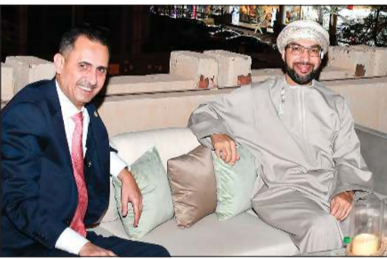
سفير عمان د.صلاح الخروصي وسفير الأردن صقر أبوشتال