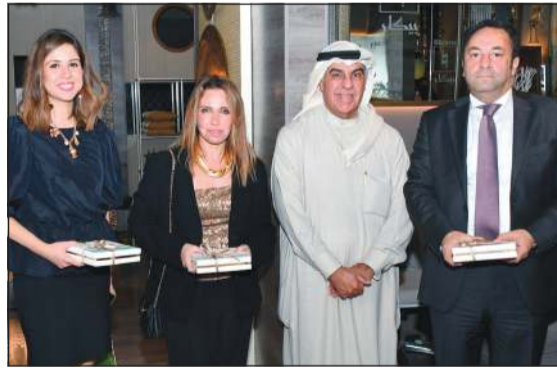
الشيخ جابر الفيصل ووفد السفارة المصرية بحضور حرم سعادة السفير