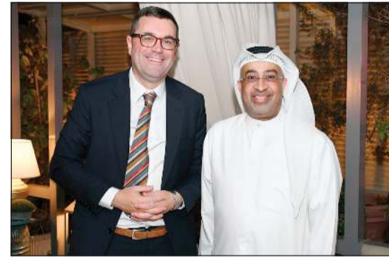
سفير أستراليا جوناثان جيلبرت وحسام الرشيد