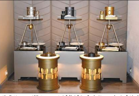
قطع فنية وتصاميم ومنتجات كويتية تراثية تمزج بين عبق الماضي ورونق الحاضر

نظم مركز ريكونسنس للبحوث والدراسات، أمسية ثقافية ضمت العديد من السفراء والديبلوماسيين الأجانب في معرض «بيكار» في إطار حرصه على تعريفهم بالمجتمع الكويتي وتراثه الثقافي والفكري وما يتميز به من لمسات إبداعية وجمالية فريدة.