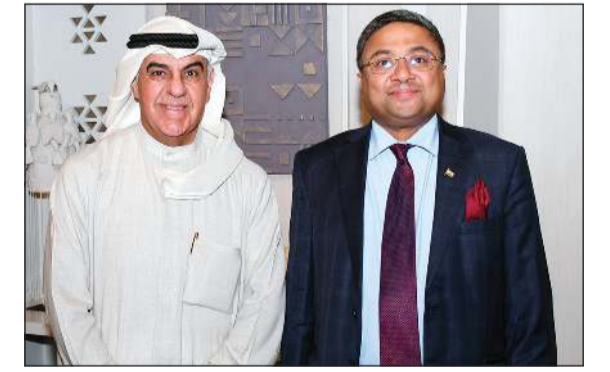
سفير الهند سيبني جورج والشيخ جابر الفيصل