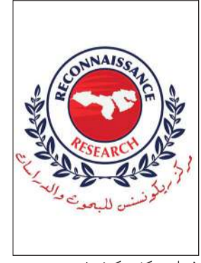
شعار مركز ريكونسنس