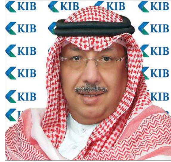
الشيخ محمد الجراح

الشيخ محمد الجراح: شدة الأزمات لم تمنعنا من اقتناص أقوى الفرص وتحويلها إلى إنجازات ومدرسة بتعزيز وتنويع أنشطتنا الاستثمارية