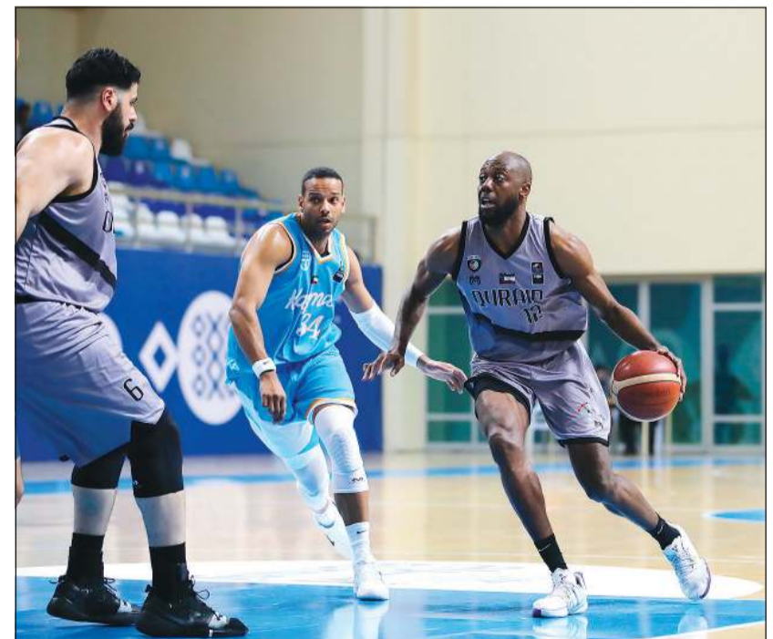
جانب من مواجهة كاظمة والقرين في القسم الثاني للدوري الممتاز