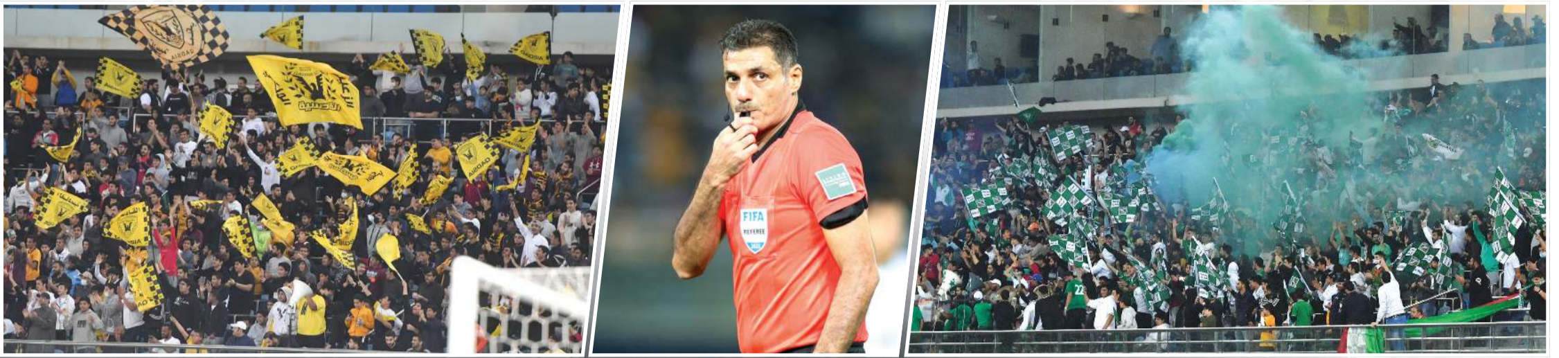
'ديربي' العربي والقادسية شهد جدلاً واسعاً (محمد شاشم)