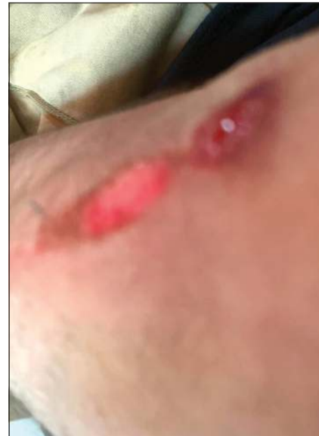
الطالب نجا من الدهس بعد إصابات لحقت به

يتعمدون عدم التوقف للطالب كونهم معفيون من التذكرة. على صعيد آخر، قال مصدر أمني إن رجال مباحث السالمية تمكنوا من تحديد هوية شابين ظهرا في مقطع الاعتداء على سائق الباص أمس الأول وجار ضبطهما.