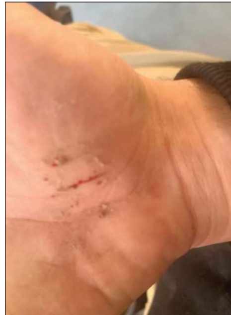
كف الطالب وتبدو آثار الجروح عليها