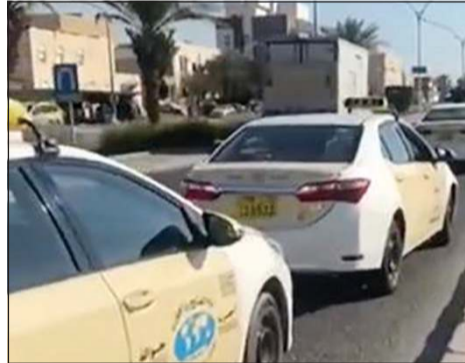
الحملة أقيمت في محيط المطار

أسفرت حملة مرورية لإدارة التنسيق والمتابعة التابعة للإدارة العامة للمرور عن تحرير عشرات المخالفات لمركبات أجرة «مركبات جولة وأجرة المطار» ومكاتب تأجير مركبات وأخرى ليموزين. وقال مصدر أمني إن التركيز تم على حيازة رخص سوق وتراخيص قيادة لمركبات أخرى والتأكد من تشغيل العدادات وأجهزة التتبع، مشيرا إلى أن الحملة جرى تنفيذها في يوم أمس الأول في محيط مطار الكويت.