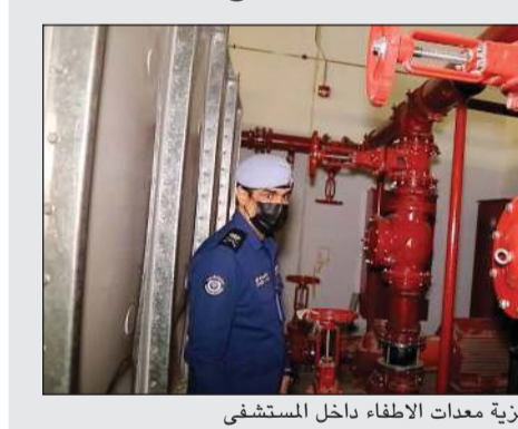
اللواء خالد الفهد يتأكد من جاهزية معدات الإطفاء داخل المستشفى

ويتكون المشروع من 8 أدوار بمساحة كلية تبلغ 10 آلاف متر مربع. وقال اللواء خالد فهد أن هذه الزيارة تأتي بناء على توجيهات من رئيس قوة الإطفاء العام الفريق خالد المراد المتابعة وتسريع تراخيص جميع المشاريع التنموية والكبرى في البلاد بعد التأكد من استيفاء اشتراطات السلامة والوقاية من الحريق وفقا لخطط واستراتيجيات قوة الإطفاء العام لحماية الأرواح والممتلكات لتحقيق الأمن المجتمعي.