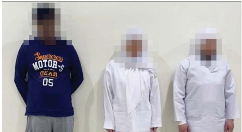
الموقوفون في مكتب التمريض الوهمي

أسبوعين يقومون بمهمة التمريض المنزلي وضبط 15 مخالفا لقانون الإقامة من مختلف الجنسيات في حملة مفاجئة على منطقة أمفرة، وتم تحويلهم إلى جهة الاختصاص لاتخاذ الإجراءات القانونية بحقهم. وقال مصدر أمني إن جميع الموقوفين جار إبعادهم.