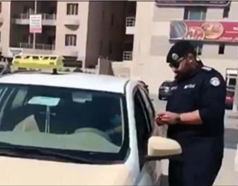
رجل أمن يمدق على رخصتي السوق والمركبة

أسفرت حملة مرورية لإدارة التنسيق والمتابعة التابعة للإدارة العامة للمرور عن تحرير عشرات المخالفات لمركبات أجرة «مركبات جولة وأجرة المطار» ومكاتب تأجير مركبات وأخرى ليموزين. وقال مصدر أمني إن التركيز تم على حيازة رخص سوق وتراخيص قيادة لمركبات أخرى والتأكد من تشغيل العدادات وأجهزة التتبع، مشيرا إلى أن الحملة جرى تنفيذها في يوم أمس الأول في محيط مطار الكويت.