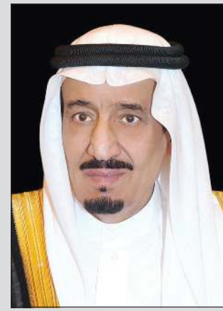
خادم الحرمين الشريفين الملك سلمان بن عبدالعزيز

كويتية • يومية • سياسية • شاملة • 100 فلس • 24 صفحة