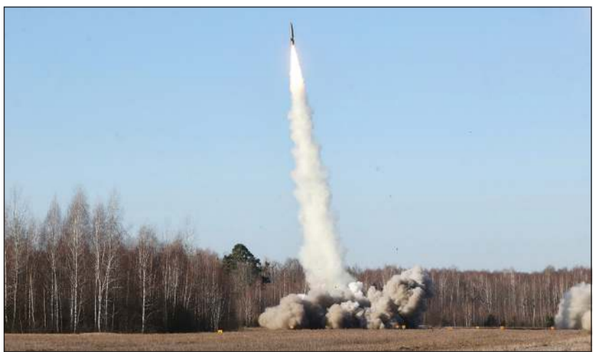
صاروخ روسي متطور يطلق من بطاريته خلال المناورات العسكرية المشتركة الجارية في بيلاروسيا أمس

عواصم - وكالات: زف فريق من العلماء والباحثين الأميركيين بشرى سارة إلى العالم بقرب التوصل إلى لقاح شامل فعال ضد جميع متحورات فيروس «كورونا»، في المستقبل، بالتزامن مع مواصلة العديد من الدول رفع القيود الصحية لاحتواء الوباء. فقد توصل فريق بحثي من «معهد سكريبس للأبحاث» في الولايات المتحدة إلى موقع ضعيف يوجد في البروتين الفيروسي الرئيسي لفيروس كورونا، وهو بروتين الأشواك الذي يمنح الفيروس شكله التجاعي الشهير. وكشف الباحثون، في دراسة نشرت مؤخراً بدورية «بايسنس ترانسليشن ميديسن»، أن استهداف هذا الموقع يمكن أن يساعد في تصميم لقاحات واسعة المفعول وعلاجات بالأجسام المضادة تعمل ضد جميع فيروسات كورونا التي قد تنتقل من الحيوانات إلى البشر في المستقبل، حيث يعتقد الباحثون على نطاق واسع أن أوبئة فيروس كورونا المستقبلية التي تنتقل من حيوان إلى إنسان أمر لا مفر منه.