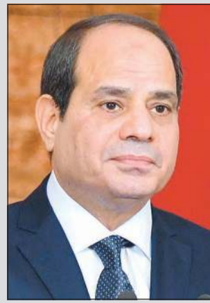
الرئيس المصري عبدالفتاح السيسي

شيخ الأزهر: جهود خادم الحرمين والرئيس السيسي قضت على حركات الإرهاب والتطرف