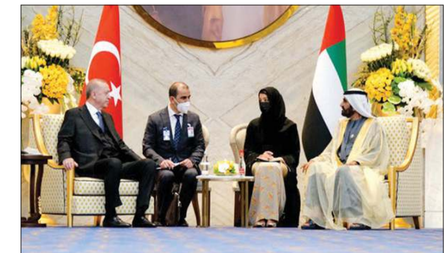
صاحب السمو الشيخ محمد بن راشد مستقبلاً الرئيس رجب طيب أردوغان

عواصم - وكالات: استقبل صاحب السمو الشيخ محمد بن راشد آل مكتوم نائب رئيس دولة الإمارات العربية المتحدة رئيس مجلس الوزراء حاكم دبي، أمس الرئيس التركي رجب طيب أردوغان في معرض «إكسبو 2020 دبي». وقالت وكالة أنباء الإمارات الرسمية «وام» إن الجانبين بحثا خلال اللقاء «سبل تطوير العلاقات الثنائية بين البلدين الصديقين». وقال الشيخ محمد بن راشد عقب لقاء أردوغان: «متفائل باستقرار وازدهار كبير تقوده الإمارات وتركيا في المنطقة». وأضاف أن «زيارة الرئيس التركي لمعرض «إكسبو 2020 دبي» تؤسس لمرحلة جديدة من التعاون والشراكة الإستراتيجية بين الإمارات وتركيا.. آفاق كبيرة تراها في علاقاتنا الاقتصادية والتنموية مع تركيا». من جهته، قال أردوغان إن معرض «إكسبو 2020 دبي» الذي تستضيفه دولة الإمارات هو «دعوة لإنشاء مستقبل جديد معا». في اليوم الثاني من زيارته الرسمية للإمارات، دعا الرئيس التركي، رجال الأعمال ومثقفين عن القطاع الخاص الإماراتي إلى الاستثمار في بلاده. وقال إن هدف بلاده المشترك مع الإمارات يتمثل في الارتقاء بالعلاقات الثنائية في كل المجالات إلى مستوى أعلى بكثير.