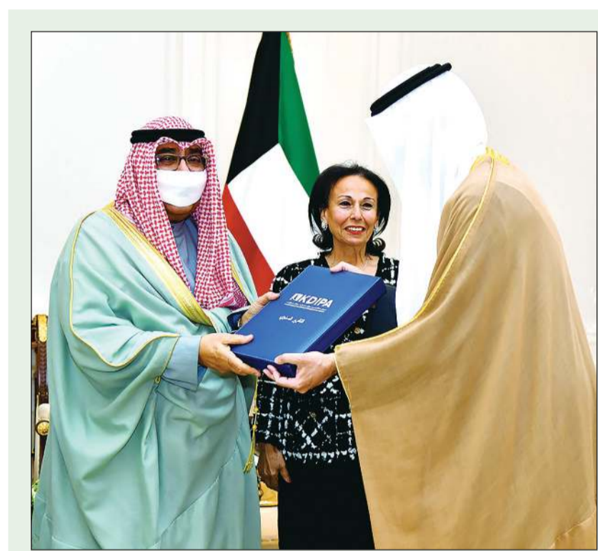
سمو ولي العهد الشيخ مشعل الأحمد خلال تسلمه التقرير السنوي السادس لهيئة تشجيع الاستثمار لسنة 2021 من الشيخ مشعل جابر الأحمد والسيدة وفاء أحمد القطامي

إصابات «كورونا» تعاود الانخفاض ونسجل 2166 حالة جديدة 02