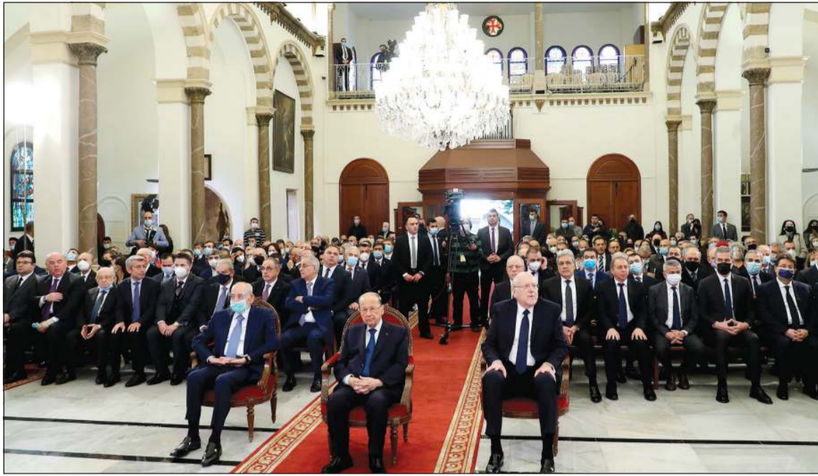
الرئيس اللبناني ميشال عون ورئيس مجلس النواب نبيه بري ورئيس مجلس الوزراء نجيب ميقاتي خلال مشاركتهم في القداس بكنيسة مار مارون (محمود الطويل)

هو لبناني وقراره لبناني، وصديق وحليف مع إيران.. القوات اللبنانية وعبر إذاعة «لبنان الحر» توجهت بسؤال إلى رئيس الجمهورية ميشال عون وفيه «هل سمعت على طرحة السيد حسن نصرالله على طرحة إجراء الحصار، بان وجوده في مجلس النواب لحماية المقاومة، وبالتالي ان سلاح الحزب أكبر مما ستخرجه التدقيق الجنائي وإلى اتهام