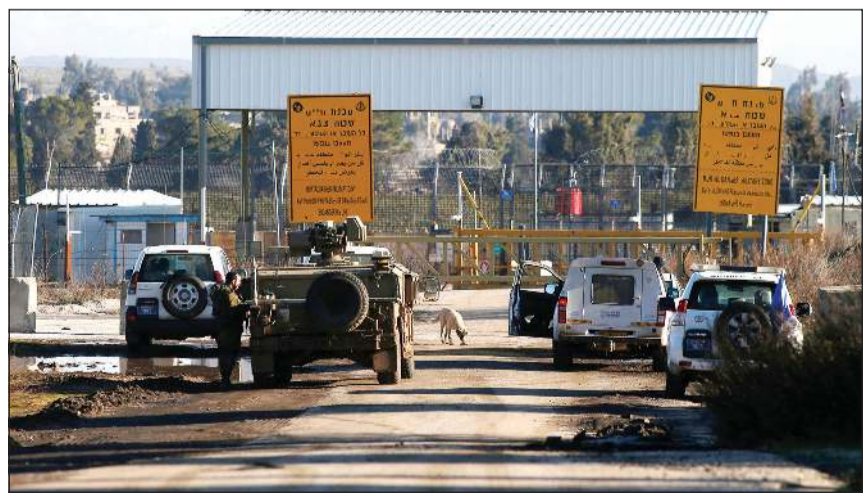
مركبة عسكرية إسرائيلية وسيارات تابعة للأمم المتحدة عند معبر القنيطرة

عواصم - وكالات: تصدت الدفاعات الجوية السورية التابعة للجيش السوري لعدوان إسرائيلي بالصواريخ في سماء دمشق، وتمكنت من إسقاط عدد منها، حسبما أفادت وكالة الأنباء السورية (سانا) أمس. ونقلت «سانا» عن مصدر عسكري لم تتسمه قوله ان إسرائيل نفذت عدواناً جويًا برشقات من الصواريخ من الاتجاه الجنوب الشرقي لبيروت، كما نفذت عدواناً بصواريخ أرض-أرض من اتجاه الجولان السوري المحتل مستهدفاً بعض النقاط في محيط مدينة دمشق، مؤكداً أن وسائط الدفاع الجوي السوري تصدت للصواريخ الإسرائيلية وأسقطت بعضها، وجرى العمل على تدقيق نتائج العدوان. وقالت «سانا» إن جندياً سورياً قتل وأصيب 5 آخرون بجروح من جراء القصف الصاروخي الإسرائيلي. وكان التلفزيون الرسمي