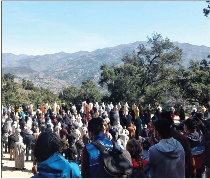
جموع من المشيعين في جنازة «طفل البئر»