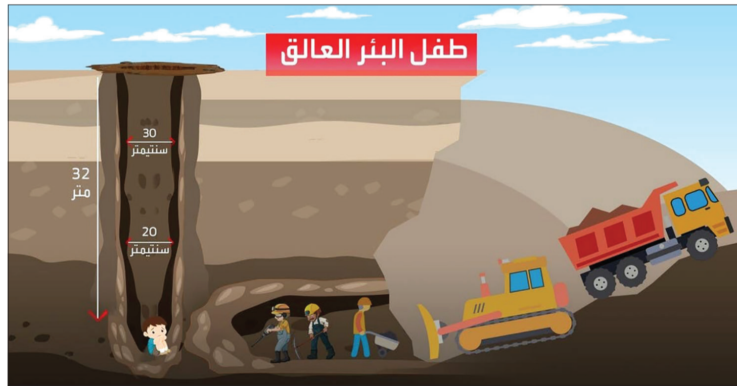
رسم توضيحي نشرته «العربية نت» لجهود الإنقاذ

الناس العاديين إلى المنطقة لأجل متابعة عملية الإنقاذ عن قرب. وقال مواطنون مغاربة إنهم جاءوا من مدن أخرى تبعد مئات الكيلومترات مثل الدار البيضاء وفاس وإفراغ حتى يكونوا في موقع الحدث، كبرياء ظلت ترابط في المنطقة، في انتظار أن يرد أي جديد بشأن الطفل ريان.