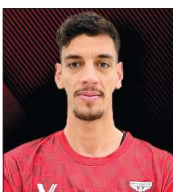
الجزائري مختار كوري

26 الجاري. وقال الاتحاد في بيان إن 4 فرق ستشارك في البطولة هي أندية الكويت (بطل الدوري) والقادسية (ثاني الدوري)، والسالمية صاحب المركز الثاني في بطولة الكأس، والعربي صاحب المركز الثالث في بطولة الكأس. وأوضح الاتحاد أن الدور التمهيدي يتضمن مباراتين تجمع الأولى العربي مع القادسية، فيما تجمع الأخرى الكويت مع السالمية يتأهل الفائزان فيهما للدور النهائي، فيما يلعب الفرقان الأخران مباراة تحديد المركزين الثالث والرابع. إلى ذلك، يتواصل مسلسل الخصومات والعقوبات المالية بحق لاعبي المنتخب الوطني بعد عودتهم إثر انتهاء مشاركتهم مع الأزرق في بطولة كأس آسيا، حيث تعرض اللاعب صالح الموسوي إلى عقوبات مالية من مقر عمله رغم وجود تفرغ رياضي.