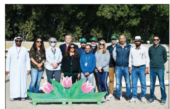
الحكام المشاركون في البطولة

تواصل اليوم منافسات بطولة الكويت الدولية لقفز الحواجز (فئة 3 نجوم) إحدى جولات الدوري العربي المؤهل إلى بطولة كأس العالم المقرر إقامتها في جمهورية ألمانيا أبريل المقبل.